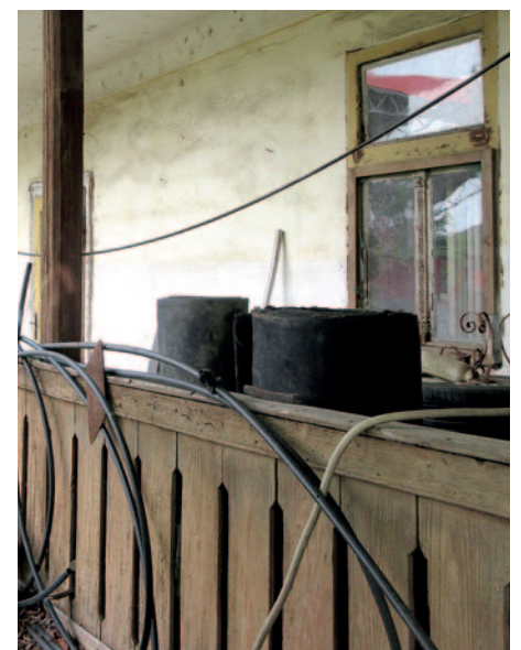
A falusi házakra jellemző volt a fedett folyosó, azaz a tornác kialakítása.