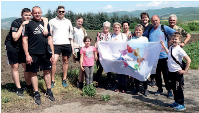
Kellemes idő volt a kirándulásra.