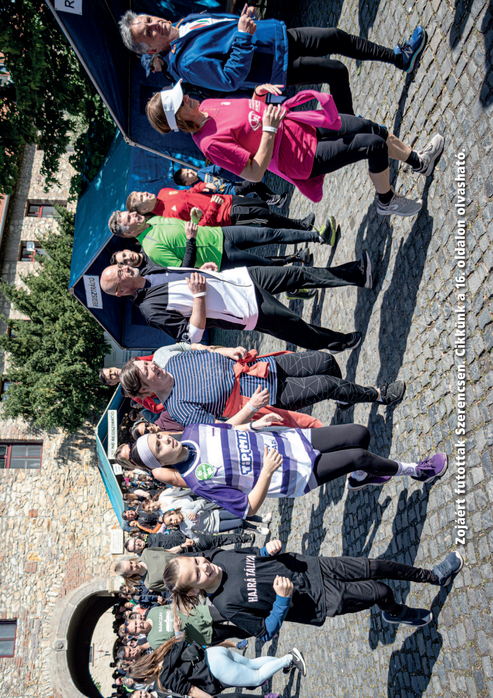
Zo jáért futottak Szerencsen. Cikkünk a 16. oldalon olvasható.