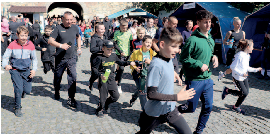
A jótékonyági futóversenyen minden korosztály részt vett.