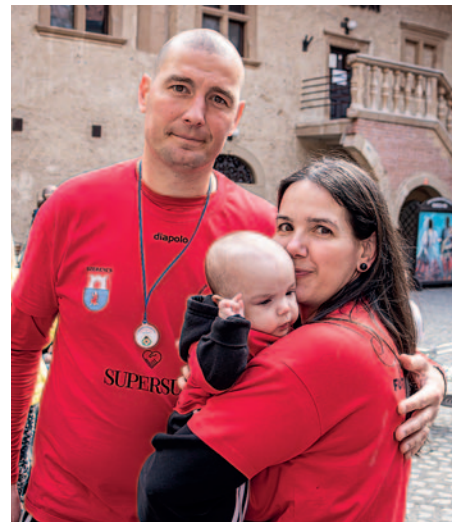
A szülők mindent megtesznek a gyógyulásért.

A helyszínre érkezett több mint 1500 nevező három táv közül választhatott: 500, 2024 és 12000 méter. A legtöbben a 2024-es távban indultak, amely igazából nem is volt verseny, inkább a részvétel számított. Óvodások, fiatalok és idősek egyaránt jelen voltak. Az aukción és a futás nevezési díjaiból befolyt összegből Zoja további kezelését fogja finanszírozni a család. Információink szerint csak a helyszínen több mint 4 millió forint gyűlt össze. A teljes bevétel várhatóan több mint 8 millió forint lesz. A távot teljesítők