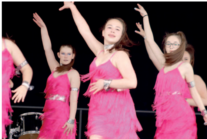
A Szikra Tánciskola növendékei