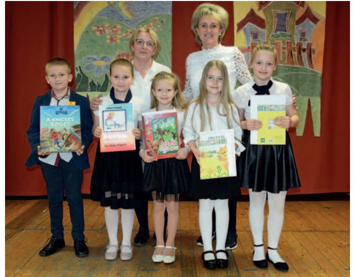
A Rákóczi iskolában hamar felismerik a tehetségek gyerekeit.

Tehetséghetünket április 17-én gálaműsorral zártuk. A Felső-magyarországi Tehetségsegítő Tanács és intézményünk erre az alkalomra létrehozta a „Sokszínű tehetség” Regionális Református Talentum díjat. Ezt a felépők és felkészítő tanáraik kapták meg, annak elismeréseként, hogy a téri vizuális, a nyelvi, az interperszonális és a zenei tehetség területeken intézményük legjobbjai tudásukat, tehetségüket megosztották velünk ezen a napon. A színes, magas színvonalú rendezvényen nyolc városból több mint 30 gyermek kimagasló teljesítményében gyönyörködhattünk. Kísérő programként digitális képgalériában jelentek meg az intézmények