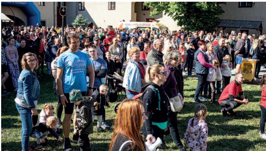
Rengetegen érkeztek a Rákóczi-várba.

A III. Városnapi Futás ezúttal jótékony céllal kerül megrendezésre, április 21-én. Minden nevezési díjjal egy beteg kislány gyógyulását támogatták a résztvevők.