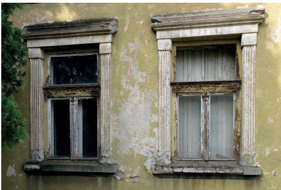
A két ablak mögött van a tisztaszoba.