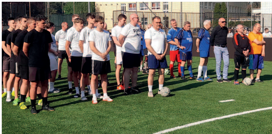
Hagyományteremtő szándékkal rendeztek focitornát.

Felavatták a Bocskai István Katolikus Gimnázium és Technikum felújított műfüves focipályáját, április 11-én – olvasható az iskola közösségi oldalán.