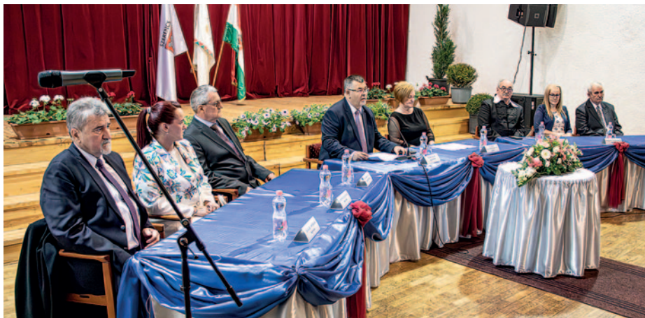
Az ünnepi képviselő-testület ülése a színházteremben.

Szerencs Város Önkormányzata 1998 óta minden évben – idén már 26. alkalommal – ünnepi Szerencs Város Napját április 20-án, emlékezve arra, hogy 1605. április 17–20. között itt tartottak országgyűlést, amelyen Bocskai Istvánt Magyarország fejedelemvé választották. A képviselő-testület hagyományosan ekkor adja át a kitüntetések azoknak, akik az elmúlt években hozzájárultak a település gazdasági, társadalmi és szellemi életének fejlődéséhez. Ezeknek az átadására április 19-én került sor a Rákóczi-vár színháztermében.