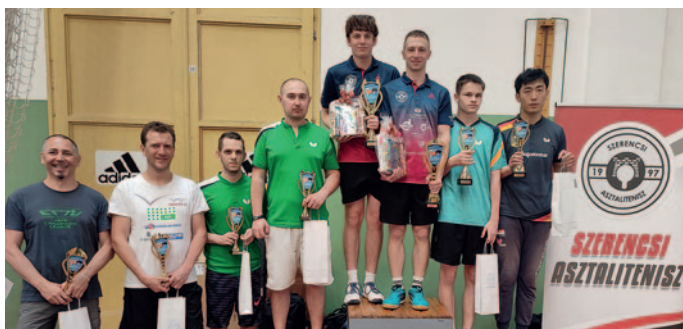
Az összevont páros győztesei.