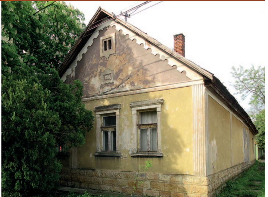
Az épület 1924-ben épült.

Érdekes az épület, mert a kisvárossá válás útjára lépett Szerencs átalakulása mintegy lenyomatként megjelenik rajta. Alapformája a sok száz éves mezőgazdasági települések hosszanti nyeregteretű és tornácsos lakóházát mutatja, az utca felé két ablakkal a tisztaszobán és egy ablakkal a tornác lezárásaként. Az utcai szoba mögött szinte mindig a pitvar és konyha egysége következett, majd egy másik szoba és/vagy a kamra. A fedett folyosó, azaz a tornác mívesen elkészített faszerkezet: faoszlopok támasztják alá és széles deszkák formálják a korlátot, s a deszkák között díszítésként ferde felső és alsó véggel faragott rések láthatók. Jellemző ezekre az épületekre az egyszerű nyeregteretű cserép fedéssel, amely itt a híres és akár száz évnél is többet bíró, szép rajzolatú Bohn-cserép. Jellemző elem még Hegyalján a lakóház mellet, az utcafrontra épített borház, vagy nyárikonyha, melyet itt is megtalálunk, valamilyen gazdasági funkcióval. A fenti régies és falusiasnak mondható jellegzetességeken túl azonban sok kisvárosias elemet is találunk a házon. A legfeltűnőbb, hogy az épület vége bekanyarodik egy keskenyebb szár-