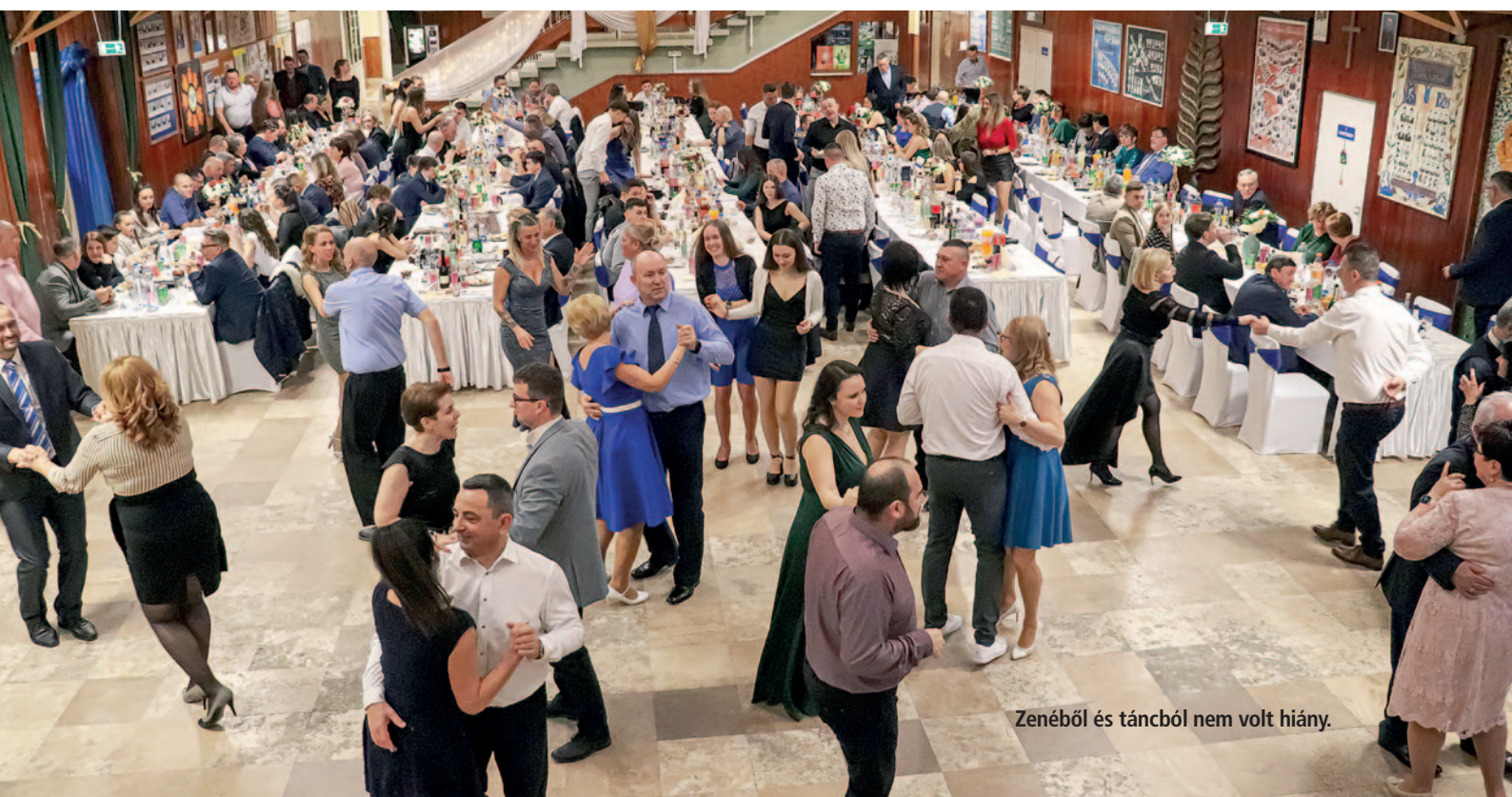
Zenéből és táncból nem volt hiány.