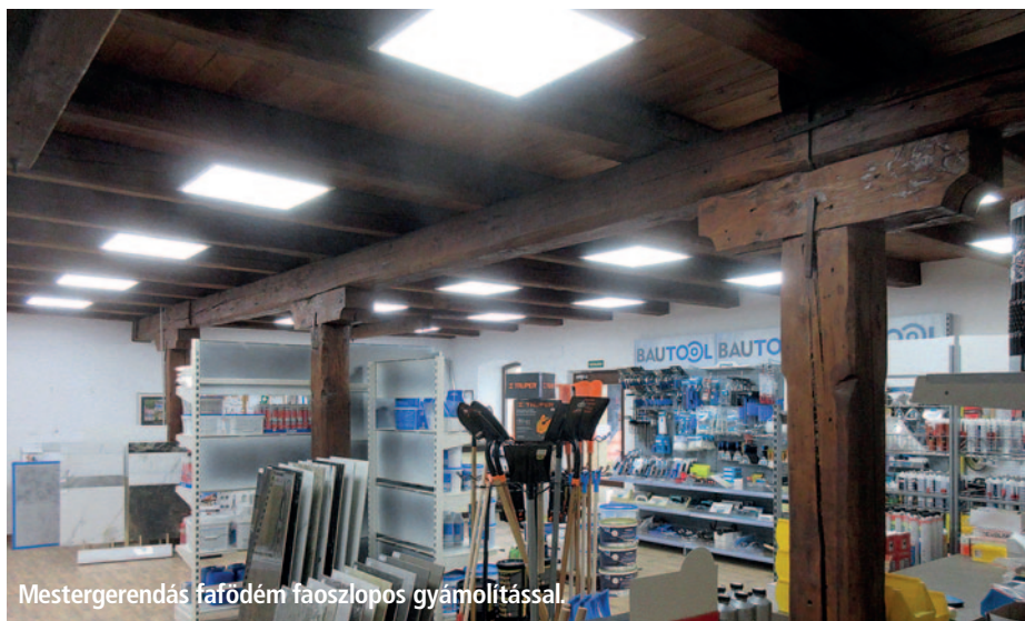
Mestergerendás fáfödém faoszlopos gyámlóítással.