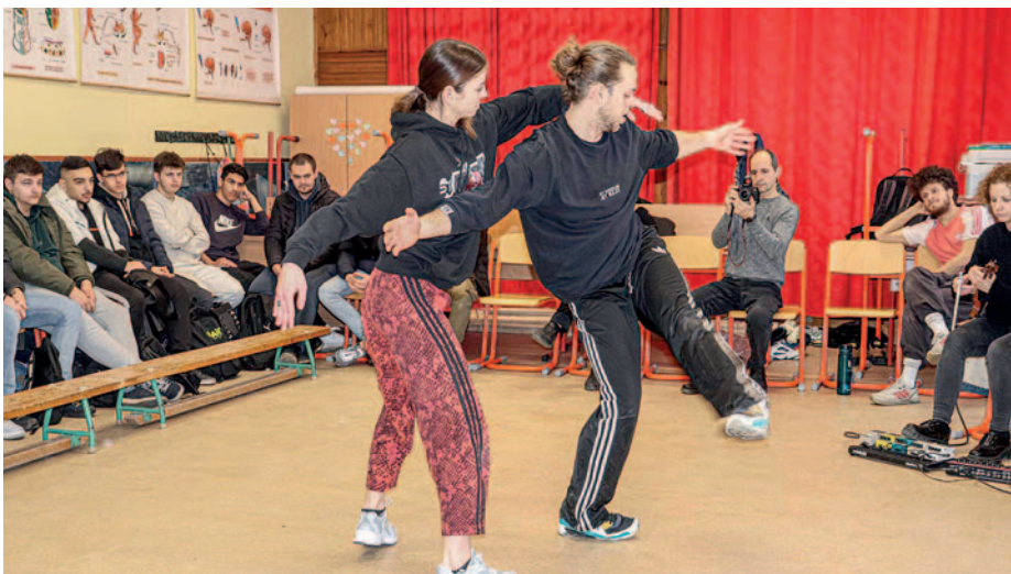
A Willany Leó Improvizációs Táncszínház előadása.