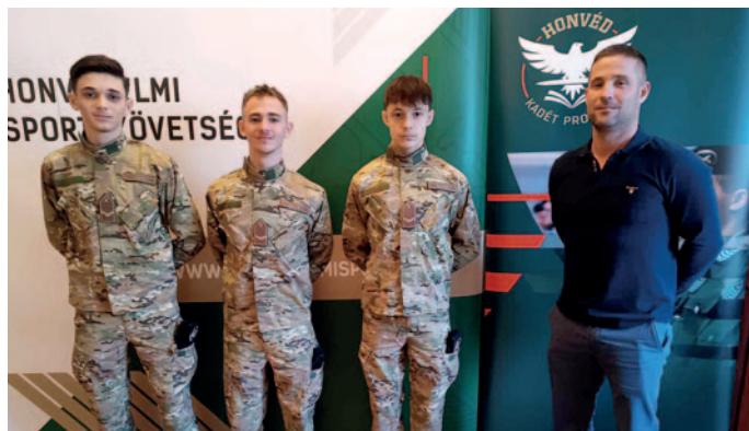
Bizonyítottak a fiatal kadétek.

A Honvédelmi Sportszövetség elnöke arról is beszélt, hogy olyan korban élünk, amikor több irányból is veszélyeztetik a nemzeti értékeket, a kultúránkat, ezért kell egy világos, egészséges szűrő, egy stabil értékrendszer, amely-