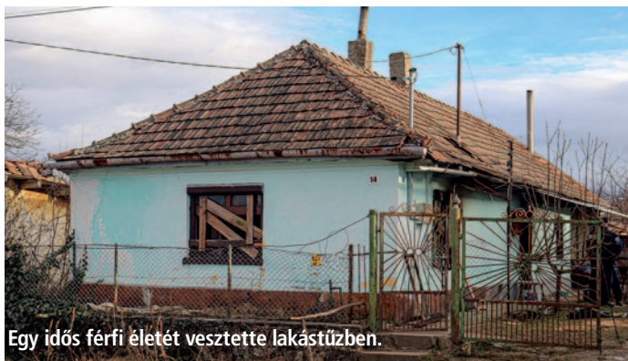
Egy idős férfi életét vesztette lakástűzben.

A katasztrófavédelemhez február 5-én délelőtt érkezett a jelzés, hogy Monokon kigyulladt egy épület.