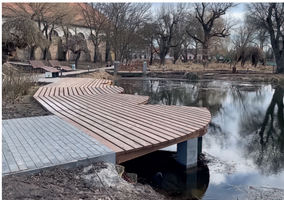
A stég kedvelt helyszíne a házasságkötők szemében.

A bejárás során készített videó teljes terjedelmében megtekinthető a Szerencsi Hírek, YouTube csatornáján.