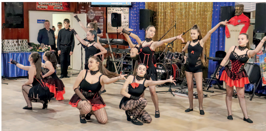
A Szikra Tánc- és Mozgásstúdió zenés táncprodukciója.

A táncos műsor után Szerencs Város Sportegyesülete ünnepélyes keretek között fejezte ki tiszteletét és nagyrabecsülését az elmúlt évben ki-