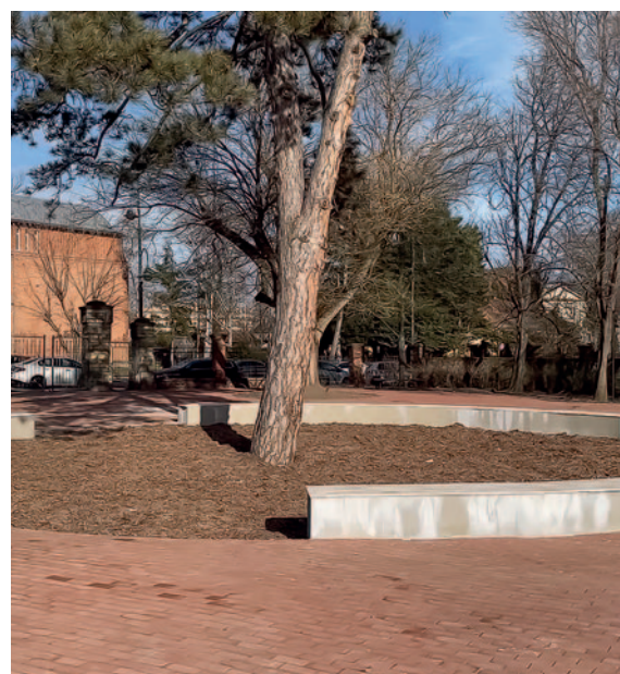
A fogadótér a közel 150 éves védett feketefenyő körül került kialakításra.