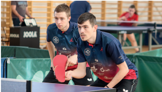
Szép labdameneteket láthattak a nézők.

Az NB I-es szerencsi asztalitenisz csapat február 4-én a szegedi gárdát fogadta, míg az NB II-es együttesünk az utánpótláskorú debrecenieikkel játszott.