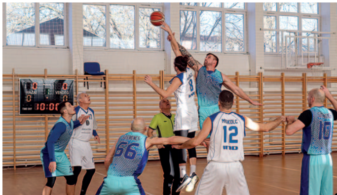
A kék mezés szerencsiek eddig nem akadtak legyőzőre.

Ismét bajnoki rendszerben tudnak versenyezni a vármegyei felnőtt kosárlabdacsapatok. A szezon alatt körmérkőzéses lebonyolításban mindenki játszik a másikkal, de a fordulók azonos helyszínen kerülnek megrendezésre, ezáltal időt, pénzt és energiát spórolnak meg a klubok.