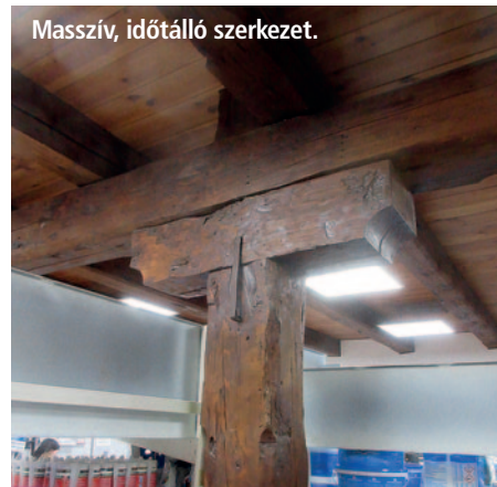
Masszív, időtálló szerkezet.

Alapozás és tartófalak: tömör téglakő vegyes falazatok, nyílások körül 30 cm szélességű vakolat tagozatokkal (kerettel), sarkoknál 50 cm széles vakolt lizénákkal (falpillérekkel). Födémek: régi épületrészben mestergerendás fáfödém, középső nagy teremben faoszlopos és mestergerendás gyámlóítással. Borítás 6 cm vastag fa pallózat, a gépi igények miatt jelentősen átluggatva. Tetőszerkezet: egyedi kialakítású, ollóágas, fogópáros ácsolat, közép és taréjszemenekkel, ferde támmal. Fedése teljes felületi deszkázatra készített szabványpala, eredetileg biztosan cserép fedésű volt. Nyílászárók: kovácsoltvas rácsba épített egyrétegű fix üvegezésű ablakok, helyenként kisméretű nyitható betétszárnyakkal, ezek nagy valószínűséggel eredetiek (Gulybán Ede építész tervéből).