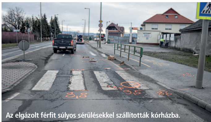
Az elgázolt férfit súlyos sérülésekkel szállították kórházba.

Az elmúlt időszakban Szerencsen már harmadszor fordult elő súlyosabb sérülésekkel járó gyalogosgázolás, ami aggasztó tény. Ezért különösen fontos, hogy mindenki fokozott figyelmet fordítson a közúti átkelés során. Még abban az esetben is, ha Önnek van elsőbbsége, többször nézzen körül és győződjön meg róla, hogy a járművek megálltak-e, mielőtt átkelne az úton. Fontos továbbá, hogy viseljen világos színű ruházatot vagy fényvisszaverő elemeket, különösen rossz látási viszonyok között, illetve