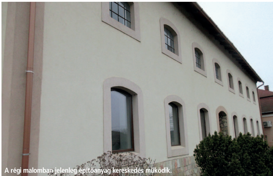
A régi malomban jelenleg építőanyag kereskedés működik.

A régi malmokról több feljegyzés maradt, a Rákóczi vár tulajdonosairól szólóokban már az 1600-as évek első felében írnak malomról: „Rákóczi Pállal közösen birtokolt a fejedelem egy kőből épült malomházat, melyet frissen zsindeleztek. A malom két kőre járt, de 1648-ra elkészült a harmadik kő padja is. A malom közeli búzavermek egy része beomlott, üresen tátongtak” – olvasható a dr. Takács Péter által írt Szerencs története c. tanulmányban. Később több helyen említik a vízimalmokat a városban: „Az 1858. évi felvételel már megfigyelhető az Ondi patakon épített vízimalom, ... Az Ondi patak vízimalma csakúgy, mint a 17-18. század fordulóján a Szerencs patakra épített Cifra-malom kerekei egyre több olyan gabonát őröltek, amelynek a szomszédos tájak ringatták a kalászát” – idézet Szerencs néprajzához c. tanulmányból, amit dr. Viga Gyula írt. Ondi patakon két malomról ír az 1800-as évek közepén Fényes Elek, melyek már az 1780-as években készült katonai térképen is jelöltek. Az 1867-es kataszteri térképen a Kishomokos Tanyán is mutat egy malmot. Ezek mind vízimalmokként szolgáltak, valamelyik vízfolyásra telepítve, és így „ingyen” energiát használva. Valamikor a 20. század elején épülhetett a jelenlegi Bekecsi út elején az az épület, amelyet a víz-szaemlékezések „Szerencsi múmalom”-ként emlegetnek. Ennél már a kezdetektől elektromos el-