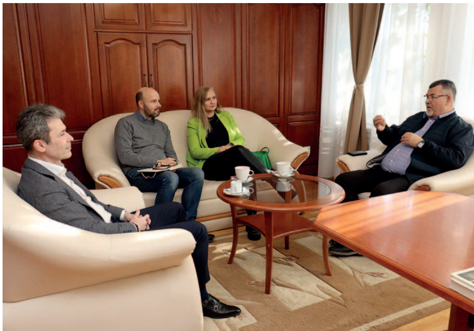
Vezetőségi megbeszélés az önkormányzatnál.

A megbeszélés során elhangzott, hogy a tavalyi évhez hasonlóan az idén is folytatódni fognak a beruházások a szerencsi gyárban, különös figyelmet fordítva a megújuló energia felhasználására, valamint a főporta épületének modernizálására a városi főépítész iránymutatásával