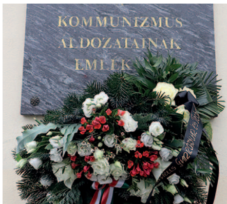
Koszorúkat, mécseseket helyeztek el az emléktáblánál.