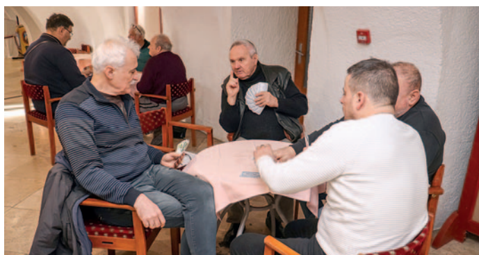
A kártyapartin összesen 18-an ültek asztalhoz.

A Szerencsi Ultiklub január 27-én megtartotta az idei év első versenyét a Rákóczi-vár árkád termében.