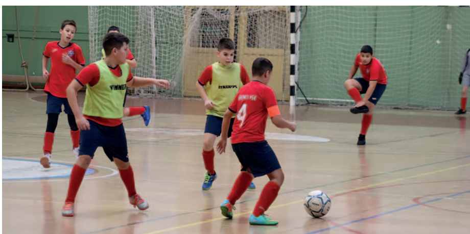
Az U13-as korosztály focizott.

A Kulcsár Anita Sportcsarnokban megjelent nyolc csapatot Kiss Dávid, a Szerencs VSE utánpótlásedzője, az esemény szervezője köszöntötte. Örömet fejezte ki, hogy ilyen sokan elfogadták a meghívást, majd röviden ismertette a játékszabályokat. Elhangzott, hogy a csapatok a 2×10 perces mérkőzéseket játszották egymás ellen, amit a döntőben 2×12-re növeltek. Nyiri Tibor polgármester szerint a focit nem lehet elég korán kezdeni. Örömeinek adott hangot, hogy Szerencs három csapattal is részt tudott venni a tornán. A városvezető hangsúlyozta: azon túl, hogy a gyerekek összemérik erejüket, egymást is megismerik, ami remek alkalom a sportkapcsolatok ápolására. Hangsúlyozta, hogy Szerencsen minden feltétel adott ahhoz, hogy a fiatalok eredményesen és profi módon játszhassanak. Az elmúlt években sok fejlesztés