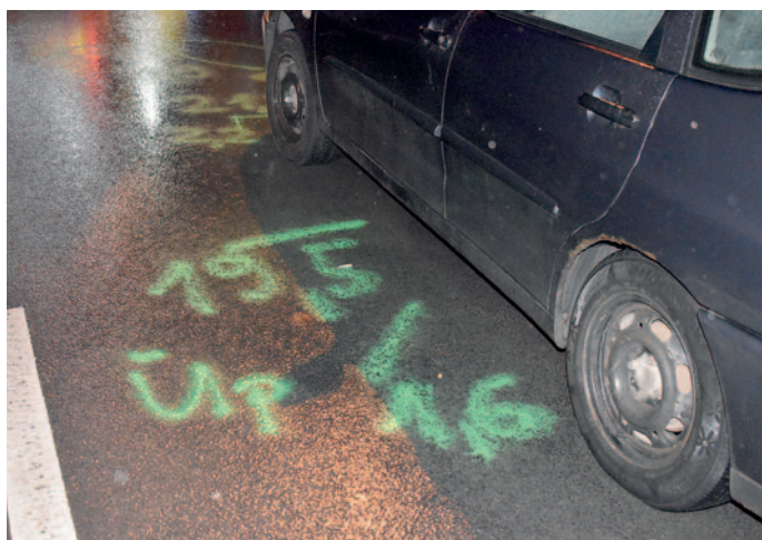
A helyszínelés idejére lezárták az érintett útszakaszt.

Nyolc napon túl gyógyuló személyi sérüléssel járó közúti közlekedési baleset történt január 17-én a késő délutáni órákban Szerencsen, az Ondi úton.