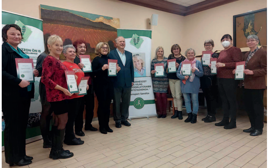
A budapesti díjátadó ünnepség résztvevői.

Ehhez a kihíváshoz csatlakozott a helyi nordic walking csoport is. „Az időszak alatt több mint kétszer végigjártuk az országos Kékkört, ami több mint 5000 kilométeres teljesítményt jelentett 2023. szeptember 25. és december 10. között. Ennek eredményeként vármegyénkben az első, or-