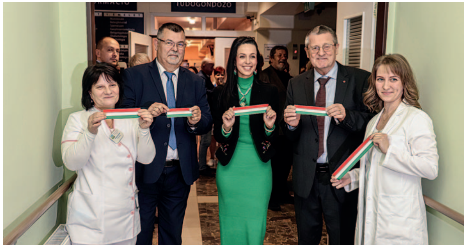
A berendezést ünnepélyes keretek között adták át.

Több éves várakozás után, december 14-én átadták az új CT berendezést a Szántó J. Endre Egyesített Szociális és Egészségügyi Intézetben (ESZEI).