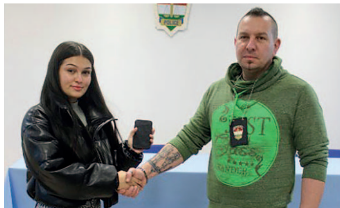
A telefont végül visszakérült jogos tulajdonosához.

Lopás miatt folytat nyomozást a Szerencsi Rendőrkapitányság egy 17 éves taktaszadai lakossal szemben. A fiatalember 2024. január 5-én 20 óra után egy városunkban, a Rákóczi úton sétáló nő kezéből kapta ki a telefonját, és elszaladt.