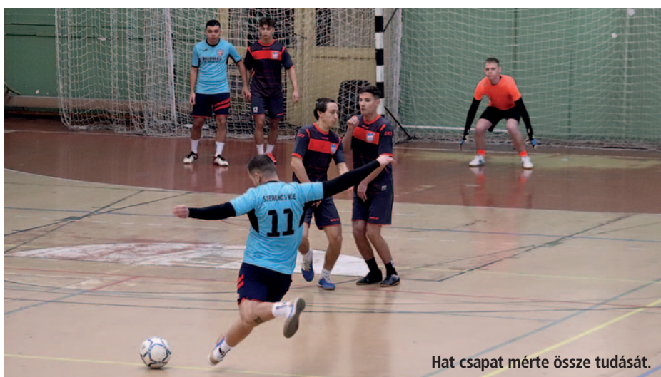
Hat csapat mérte össze tudását.

aki teljes szívéből szerette a magyar labdarúgást. Élénken él az emlékezetemben, amikor sokszor együtt szurkoltunk a pálya széléről a szerencsi csapatnak. Szinte minden helyi mérkőzésen jelen volt és biztatta focistáinkat. Emlékét kötelességünk megőrizni” – mondta a városvezető.