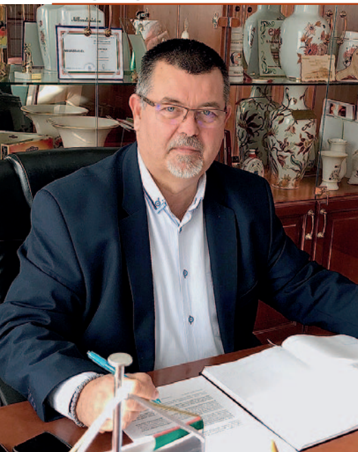
Évet értékelt a polgármester.

Természetes dolog, hogy ilyenkor visszatekinünk az előző esztendő eredményeire, és tervezgetjük az ideit évét egészségben, békében. A legfontosabb, hogy tavaly befejezhetjük azokat a projekteket, amelyek reményt adnak arra, hogy a jövőben Szerencs továbbra is egy szerethető, fejlődő kisváros legyen, ahol jó élni. Természetesen az építmények csak másodlagosak, azoktól sokkal fontosabbak a közösségek. Célul tűzzük ki ebben az esztendőben, hogy javítsuk a kommunikációt az önkormányzat, a képviselő-testület, a város vezetése, az egyes intézmények és az állampolgárok között. Ezért már tavaly év végén bevezettük a Muniplist, amin keresztül szeretnénk minden városlakóhoz eljuttatni első kézből az információkat. Ezt a jövőben is prioritásként kezeljük.