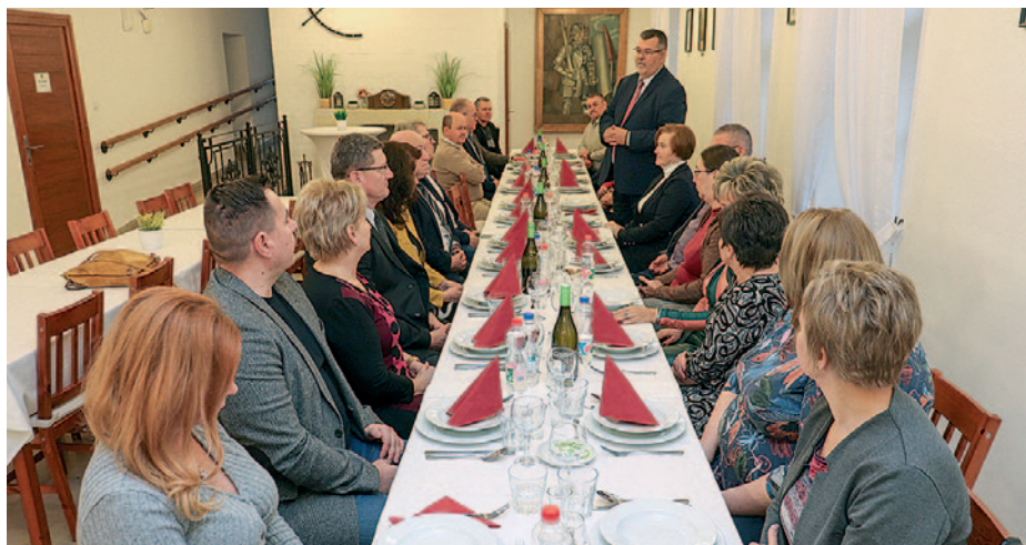
A cél a még szorosabb jövőbeli együttműködési lehetőségek feltérképezése volt.

Már hagyomány, hogy Szerencs Város Önkormányzata minden esztendő januárjának elején a településen dolgozó vállalkozóknak fejezi ki köszönetét azért, hogy a befizetett helyi adókkal hozzájárulnak a közszolgáltatások működtetéséhez, a fejlesztésekhez. Ezt a gyakorlatot követve – hagyományteremtő szándékkal – január 10-én a Rákóczi-vár Szirmay-termében tartottak évindító megbeszélést a szerencsi hivatalok-, intézmények vezetői, az igazságszolgáltatás-, a bűnüldözési szervek és a polgárőrség képviselői, valamint a non-profit cégek igazgatói.