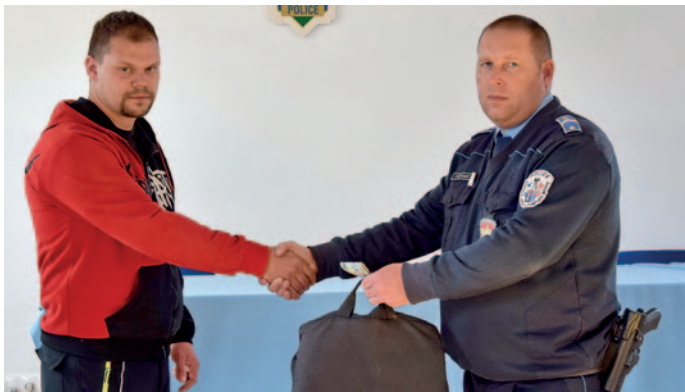
A rendőrök visszaadták az eltulajdonított pénzt.

Lopás miatt folytat eljárást a Szerencsi Rendőrkapitányság egy 36 éves rátkai férfival szemben.