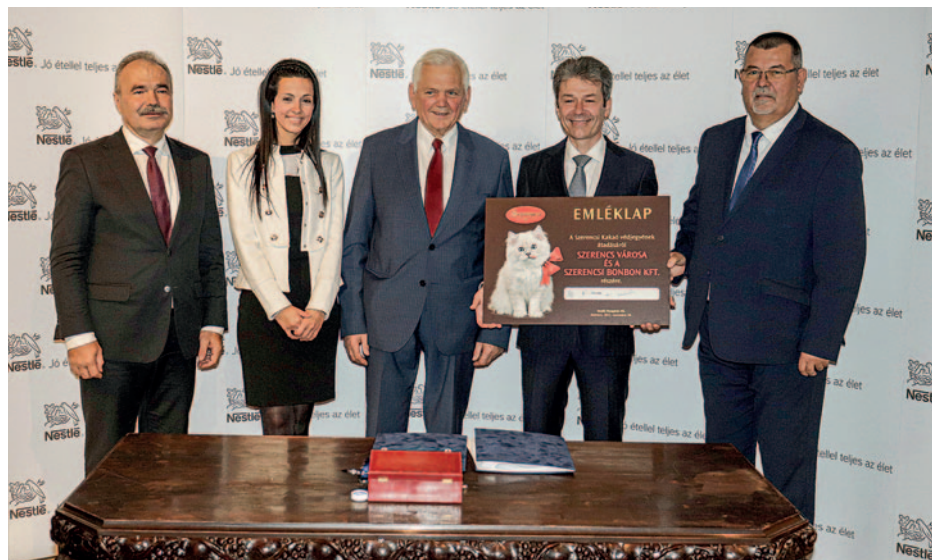
A Nestlé 2021 végén átadta a szerencsi kakaó védjegyét és a „piros masnis cica” ábrás védjegyét.