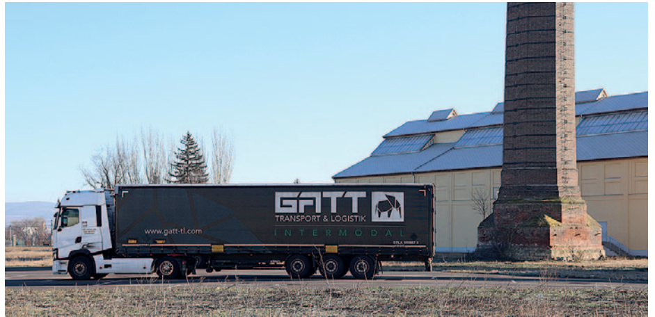
A kamionok birtokba vették az új parkolót.

Az elmúlt időszakban Szerencs Város Önkormányzata kiépítette az ipari park területén a beléptetéshez és a biztonságos közlekedéshez szükséges infrastruktúrát. Emellett a cégóriás földterületet is vásárolt és kialakította az új portáépületet. Ennek eredményeként, a műszaki bejárásokat követően és a próbaidőszak sikeres befejezésével minden feltétel adott az új forgalmi rend alkalmazásához. Ezzel egy hosszú időre visszanyúló probléma oldódik meg a vasútá-