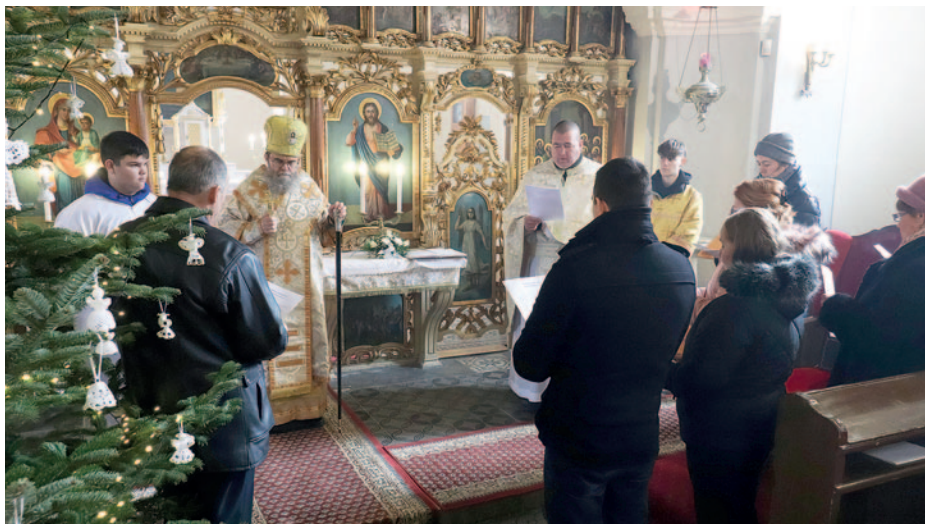
Az egyházi képviselő-testület újalakulása.

Az eseményen az egyházi képviselő-testület is újalakult, tagjai a liturgia végén tettek ünnepélyes ígéretet. Általában az a feladatuk, hogy aktívan részt vegyenek és vezetői szerepet vállaljanak az adott egyházi közösség életében. Ott vannak a fontos döntések meghozatalánál is, amik kihatnak a közösségre. Ez lehet pénzügyi kérdés, liturgikus ügyek vagy egyházi rendezvények szervezése. Fontos, hogy kapcsolatban álljanak a hívekkel, meghallgassák az igényeiket és visszajelzéseiket. A pontos feladatkör és felelősségi terület egyházanként változhat.