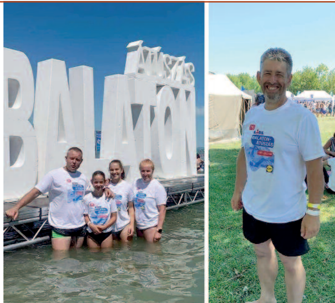
Szerencsről öten is teljesítették a távot.