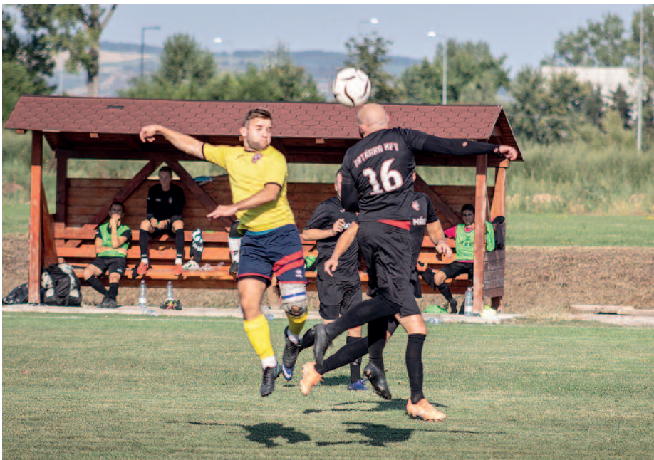
A szerencsi focisták remek teljesítményt nyújtottak a szezon első hazai mérkőzésén.