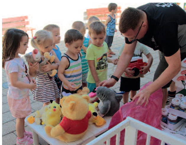
A gyerekek nagyon örültek a játékoknak.