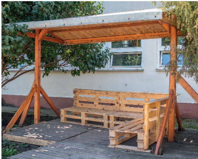
Összesen három padot készítettek, a jövőben még több épül.