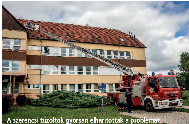
A szerencsi tűzoltók gyorsan elhárították a problémát.