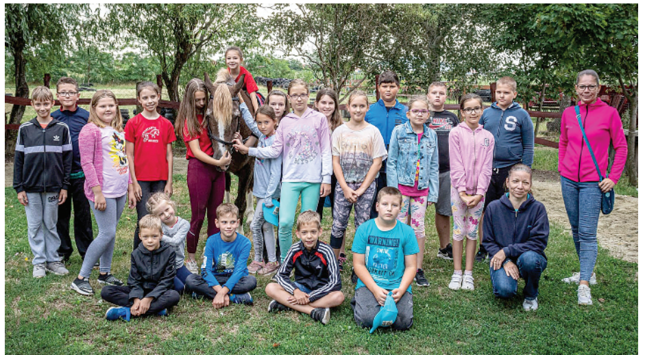
A Bekecsi Lovastanya évek óta a helyi gyerekek egyik kedvenc kirándulólhelye.

A Szerencsi Művelődési Központ és Könyvtár (SZMKK) ebben az évben is vendégül látta az Erzsébet-tábor keretében a helyi gyermekeket. Négy turnusban, július és augusztus között összesen 83 helyi diák vett részt a programban. A táborok lebonyolítására jellemzően köznevelési, kötelező közművelődési feladatot ellátó intézmények, családsegítő szolgálatok és központok jelentkezhetnek. A SZMKK már több éve sikeresen pályáz és rendez táborokat, a gyerekek mindig pozitívan nyilatkoznak. A napközi táborozás jelképes (napi 100 forint összegű) részvételi biztosíték befizetésével valósul meg turnusonként hétfőtől péntekig, 8-16 óra között. Az öt nap alatt kifejezetten a sport és az egészséges életmód, a környezettudatosság, a hagyományörzés, a kézművesség, az önismeret és a közösségépítés témájához kapcsolódó színes programokkal készülnek a szervezők. A táborokat megvalósító pedagógusoknak az Erzsébet Alapítvány szakmai javaslatainak figyelembevételével mindig a gyerekek érdeklődéséhez leginkább illeszkedő heti programtervet kell összeállítani, amelynek minden turnus esetén kötelező része egy külső kirándulás is. Ennek köszönhetően sok, kevésbé fejlett régióban élő, hátrányos helyzetű gyermek juthat el például