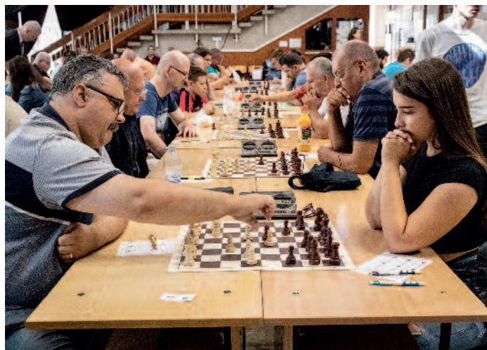
A versenyen minden korosztály képviseltette magát.