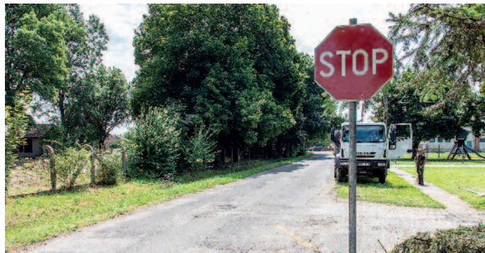
Az új tábla a gyalogosan közlekedők védelmét szolgálja.

Szerencs egyik kedvelt zöldterülete – a Vaddisznó Söröző melletti – az a játszótér, ahol egykor KRESZ-parkot is kialakítottak. A nyári időszakban sok kisgyerekes család keresi fel a parkot és a vakációzó gyerekek is szívesen töltik itt az idejüket. Lakossági kezdeményezésként érkezett igény Szerencs Város Önkormányzatához, hogy a parkot igénybe vevők (elsősorban a gyermekek) védelmében lassítani szükséges az ott közlekedő gépjárművek haladási sebességét, mivel elsősorban a Laktanya utcából a Rákóczi út irányába érkezők nagyobb sebességgel közelítik meg a területet. A szakmai egyeztetéseket követően került ki az említett környékre, a Laktanya és Hidegvölgy utcák kereszteződésbe az Állj! Elsőbbségadás kötelező! STOP jelzőtábla, ami azt jelenti, hogy az útkereszteződésbe való behaladás előtt meg kell állni és elsőbbséget kell adni a keresztező (betorkolló) úton érkező jármű részére. Tehát forgalomtól függetlenül kötelező a megállás, majd ezt követően történhet meg a továbbhaladás a Rákóczi útig. Ottjártunkkor nagyjából minden negyedik személygépkocsi a megengedett-