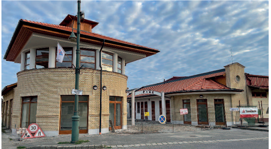
A főbejáratnál található bástyában büfé vagy kávézó kerül kialakításra.

A Szerencsi Hírek korábbi lapszámaiban folyamatosan tájékoztatást adtunk a piac felújítási munkálatairól. Nyiri Tibor, Szerencs város polgármestere szerkesztőségünket arról tájékoztatta, hogy a kivitelezés már célegyenesben van. A városvezető emlékeztetett arra, hogy az aszfaltos terület alatt olyan csatornarendszer húzódott, amely eredetileg nem szerepelt a felújítási tervekben. A kivitelezést ezért tavaly nyáron le kellett állítani. Az új műszaki tervek elkészítése időt vett igénybe, ami alatt a pályázatot elnyert beruházó levonult az építési területéről. Az új kivitelező január óta gőzerővel dolgozik a területen, hiszen a felújításnak hamarosan el kell készülnie. A beruházás magában foglalja a csarnok építését és az árusító helyek újra burkolását, továbbá zöldterületek kialakítását, ami oszlopos tölgy és nyugati platán fák ültetését jelenti. Növelték a parkolók számát, amit úgy oldottak meg, hogy a Kisvásár tér utcára merőlegesen alakították ki az új helyeket, ezzel a „trükkkel” mintegy harminc új személygépkocsihoz biztosítanak várakozási lehetőséget. A belső fedett „félig zárt” elárúsító helyen tizenkettő