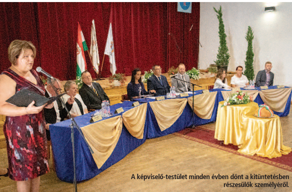
A képviselő-testület minden évben dönt a kitüntetésben részesülők személyéről.

Szerencs Város Önkormányzata hagyományosan a város napján adja át a kitüntéseket azoknak, akik az elmúlt években hozzájárultak a település gazdasági, társadalmi és szellemi életének fejlődéséhez. Az idei éven a koronavírus-járvány miatt az elismeréseket a tavalyi évhez hasonlóan az augusztus 20-i nemzeti ünnep keretében nyújtották át a Rákóczi-vár színháztermében.