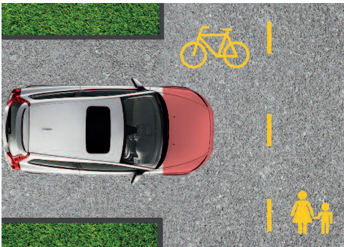
A képen látható parkoló személygépkocsi szabálytalanul állt meg.

zetek, számszerűsítve közel 150 milliárd forintot juttatott Tokaj-Hegyalja és a zempléni térség fejlesztésére, ennek részeként pedig megindul a Tokaj-Kör Kerékpáros Útvonal megvalósításának első üteme, ami várhatóan jövő tavasszal, április 30-án fog elkészülni. A fejlesztésnek köszönhetően a szőlőültetvények között is kerékpározhatnak a turisták. Nyiri Tibor, Szerencs város polgármestere elmondta, hogy a hivatal munkatársaival közösen folyamatosan montírozzák a pályázatokat, hogy a meglévő kerékpárutakat tovább bővítsék. Az elképzelés szerint az Ondi kerékpárút festői környezetben Rátkán keresztül Mádra vezetne, ahol további kerékpárutakon keresztül kapcsolódna hozzá a már meglévő tokaji hálózathoz. A városvezető hangsúlyozta, hogy hamarosan folytatódik az Ondi úton a füvesítés és a fák ültetése. A polgármester felhívja az Ondi, illetve a Magyar úton a kocsibeállókon parkoló személygépkocsik tulajdonosainak figyelmét, hogy jobban ügyeljenek a szabályos megállásra. Az utóbbi időben sok panasz érkezett az önkormányzathoz, amiben a kerékpárosok kifogásolják, hogy a járdára ráállnak az autók. Ez ugyanis mindkét félnek veszélyes helyzetet teremt. A kerékpáros a koccanás következtében megsérülhet, az autóban pedig anyagi kár keletkezhet.