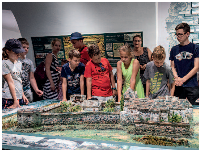
A fiataloknak rendkívül tetszett a Rákóczi-vár makettje.

– Idén nyáron 1300 egyházi táborban, hosszabb hétvégi kirándulásokon és zárandoklaton vehettek részt a gyermekek a kormány 520 millió forintos támogatásának segítségével – tájékoztató Soltész Miklós, a Miniszterelnökség egyházi és nemzetiségi kapcsolatokért felelős államtitkára július 30-án Szerencsen, ahol nyírbátori görögkatolikus táborozókat köszöntött a Rákóczi-várban. Elkerülhetetlen volt Tokaj-Hegyalja, hiszen a térség megannyi történelmi emléket, várakat, múzeumokat, templomokat, és megannyi természeti szépséget nyújt a látogatóknak. A Nyírbátori Görögkatolikus Parókia hittanosai is ezért látogattak el Szerencsre, akik előtte Tokajban, Boldogkőváralján és Vizsolyban többek között templom- és várlátogatásokon, valamint élményalapú történelemórákon vettek részt. Soltész Miklós a helyszínen elmondta, hogy ezek a programok a nemzetudatot erősítik. Az ismereteknek és élményeknek köszönhetően később hazájukat szerető, adott esetben hívő vagy kereszténységet tisztelő felnőttekké válhatnak – fogalmazott. Az államtitkár hangsúlyozta, hogy Nyugat-Európa bár gazdaságilag és életszínvonal tekintetében egy magasabb szinten van, ennek ellenére lassan elveszíti kultúráját, keresztény tradícióit. – A gyermekeknek azt szeretnénk ezekkel a táborokkal bemutatni, ami ennek a térségnek, Közép-Európának és a