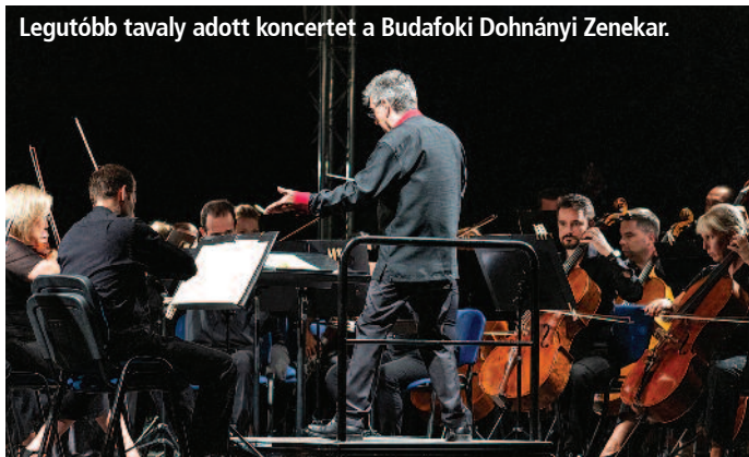
Legutóbb tavaly adott koncertet a Budafoki Dohnányi Zenekar.