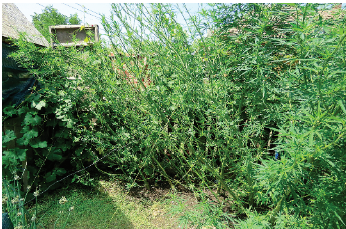
A helyi férfi a saját kertjében 58 tő marihuánát termesztett.

A Szerencsi Járásbíróság elrendelte annak a helyi férfinak a letartóztatását, akivel szemben kábítószer birtoklása büntett miatt indult büntetőeljárás. A rendelkezésre álló adatok szerint a gyanúsított tinédzser kora óta rendszeresen fogyaszt marihuánát. Idén tavasszal a saját részre vásárolt növényből kiválogatta és elvetette a magokat, a kikelt egyedeket pedig házának udvarán szétültette és gondozni kezdte. A házkutatás során a nyomozóhatóság 58 tövet, magokat, más anyagmaradványokat és mérleget foglalt le. A gyanúsított cselekménye már kábítószer birtoklása büntett megállapítására alkalmas, amely akár 5 évig terjedő szabadság-