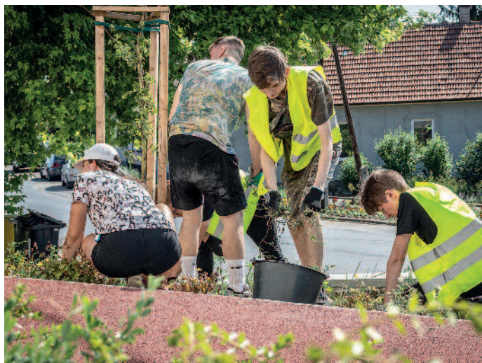
Főként kertészeti munkákat végeztek a fiatalok.

Ismét fiataloknak nyújt munka- és ezzel együtt tapasztalat valamint pénzszerzési lehetőséget Szerencs Város Önkormányzata. A diákok napi 6 órában, szakképzettséget nem igénylő feladatokat látnak el. A fiatalok ottjártunkkor a futókör melletti területeken szorgoskodtak, ahol a dísnövények közül szedték ki a gyomot, illetve megismerked-