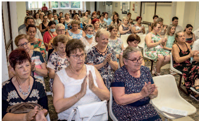
Az egészségügyi dolgozók a pandémia alatt is frontvonalban dolgoznak.

A Semmelweis-nap a magyar egészségügy napja, amelyet Semmelweis Ignác orvos, „az anyák megmentője” születésnapján, július 1-jén tartanak. Ebből az alkalomból köszöntötték Szerencsen június 30-án délután az egészségügyben dolgozókat a Szántó J. Endre Egyesített Szociális és Egészségügyi Intézetben (ESZEI). A jeles napon dr. Bobkó Géza, az intézmény igazgató főorvosa üdvözölte a megjelenteket. Beszédében elmondta, hogy a koronavírus-járvány eddig soha nem látott terhet rótt az egészségügyre, ám a szerencsi rendelőintézet állta a sarat, sőt tizenegy dolgozóval a megyei kórház munkáját is segítette több hónapon keresztül. Ezt követően