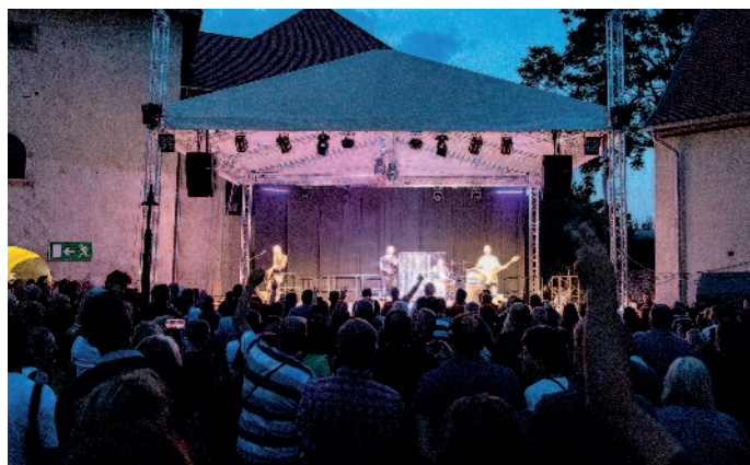
A Bikini koncertjére sokan voltak kíváncsiak.