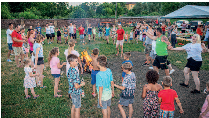
Az esemény végén a résztvevők körbeállták a tüzet.