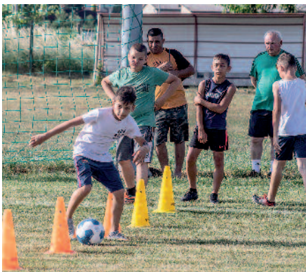
Főként ügyességi feladatokat kaptak a fiatalok.

A Szerencs VSE Labdarúgó Szakosztálya június 23-án délután toborzó napot tartott a Tatay Zoltán Ifjúsági Sporttelepen. Az edzők különböző ügyességi labdajátékokkal mérték fel a jelentkezők képességét. A szervezők fontosnak tartották, hogy az érdeklődők betekintést nyerhessenek az egyesület edzésébe, ezért azon a napon több csapat is tréninget tartott. Az évek során számos edzőmódszer fejlődött ki a fiatal labdarúgók fejlesztésére és nevelésére. Egyes európai országokban, mint például Spanyolországban és Olaszországban régóta bevett szokás, hogy már egészen kiskorban elkezdik a felkészítést. Nagy László edző érdeklődésünkre elmondta, hogy országos és helyi szinten is hasonló a helyzet. Már felső csoportos óvodás korban igyekeznek megszerettetni a kicsikkel a sportolást. – Az egész labdarúgás a gyermekkorban kezdődik el. Szerencsen is már az óvodás kortól kezdődően az U19-ig bezárólag nagyon sok gyerekkel foglalkozunk – tájékoztott az edző. Tapasztalható, hogy a mai fiatalok