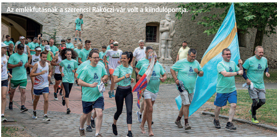
Az emlékfutásnak a szerencsi Rákóczi-vár volt a kiindulópontja.