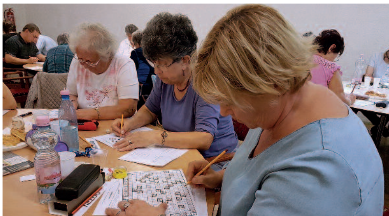
Fotónkon a 2019. évi Szerencsi Rejtvényfejtő Verseny résztvevői láthatóak.

A Szerencsi Logiklub tagjai a közelmúltban szép versenyeredményeket értek el. A koronavírus-járvány enyhülésével ismét lehetőségük volt elutazni különböző bajnokságokra. Szerencséhez hasonlóan hazánk számos városában rendeznek országos keresztrejtvényfejtő versenyt, ezek között az egyik leglátogatottabb a székesfehérvári Kedvenc Kupa. A versenyt július 26-27-e között tartották meg a székesfehérvári Községi és Kulturális Központban. Egyéni és csapatversenyében kezdő, haladó, mesterjelölt és mester szinteken mérkőznek meg egymással a rejtvényfejtők. A szerencsi versenyzők kezdő és haladó szinten ezüstéremmel tértek haza. Ezt megelőzően július 2-3 között Balassagyarmaton, az 50. Balassa Kupán vettek részt a Szerencsi Logiklub versenyzői. A Mikszáth Kálmán Művelődési központban megtartott eseményen szintén ezüstéremmel gazdagodtak.