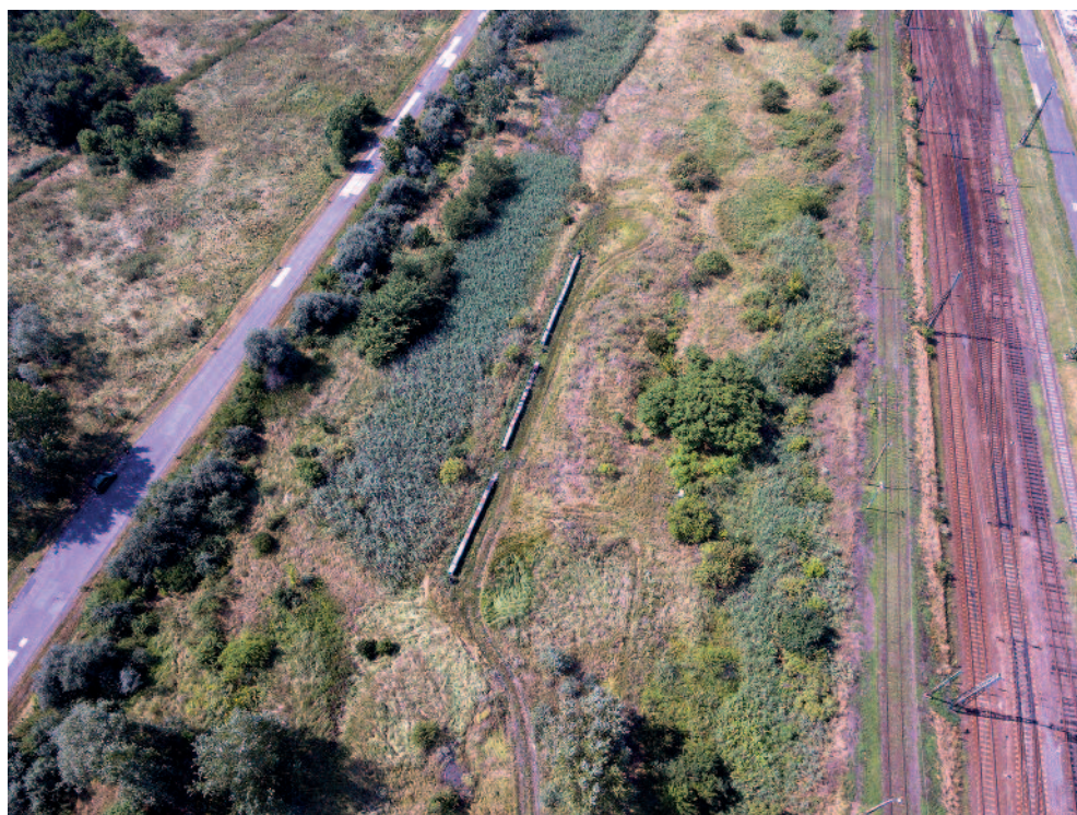
Ezen a területen valósult volna meg a beruházás