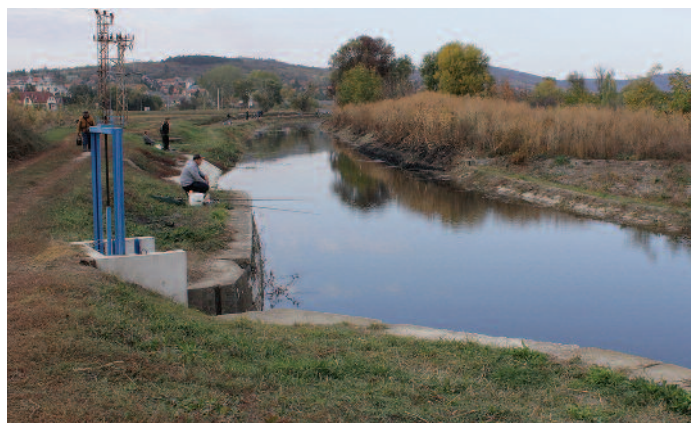
Most pedig ápoltság és rendezettség a környezet

A Szerencsi-patak és a rajta lévő zsilip, valamint a mellette található volt cukorgyári hűtőtavak hasznosításával, üzemeltetésével kapcsolatban, az önkormányzat a közeljövőben egyeztetést kezdeményez az Aggteleki Nemzeti Park és az Észak-magyarországi Vízügyi Igazgatóság megfelelő szakigazgatási szervével. A Szerencsi Horgász Egyesület és a Szerencsi Polgárőrség képviselői is részt vesznek a végső egyeztetésen. M. B.