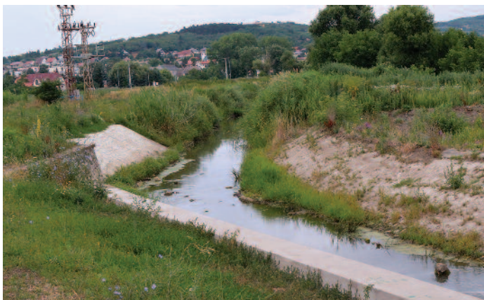
Pár hónapja még túlburjázott a zöld növényzet a patak mellett

Néhány hónapja számoltunk be arról, hogy felújították a Szerencsi-patak zsilipjét, ami az egykori cukorgyári hűtőtavakhoz vezette el a vizet. A duzzasztógátként is működő zsilip műszaki állapota az elmúlt évek alatt sokat romlott, így felújítása már időszerű volt. Azonban nem csak a zsilip, hanem a hűtőtavak környezete is átalakult. Sok pozitív visszajelzés érkezett a szerencsi lakosoktól arról, hogy igen hosszú évek óta nem volt ilyen ápoltság és rendezettség a hűtőtavak környezete. A zsilip kezelését már a Szerencsi Polgárőrség végzi, továbbá társadalmi munkában a levágott, elszáradt növényeket eltűzelték, ezzel megtisztítva a területet. A zsilip felújítása tehát megtörtént és már elkezdték duzzasztani a patakat. A közeljövőben a három tó közötti két földrészt is ki fogják bontani