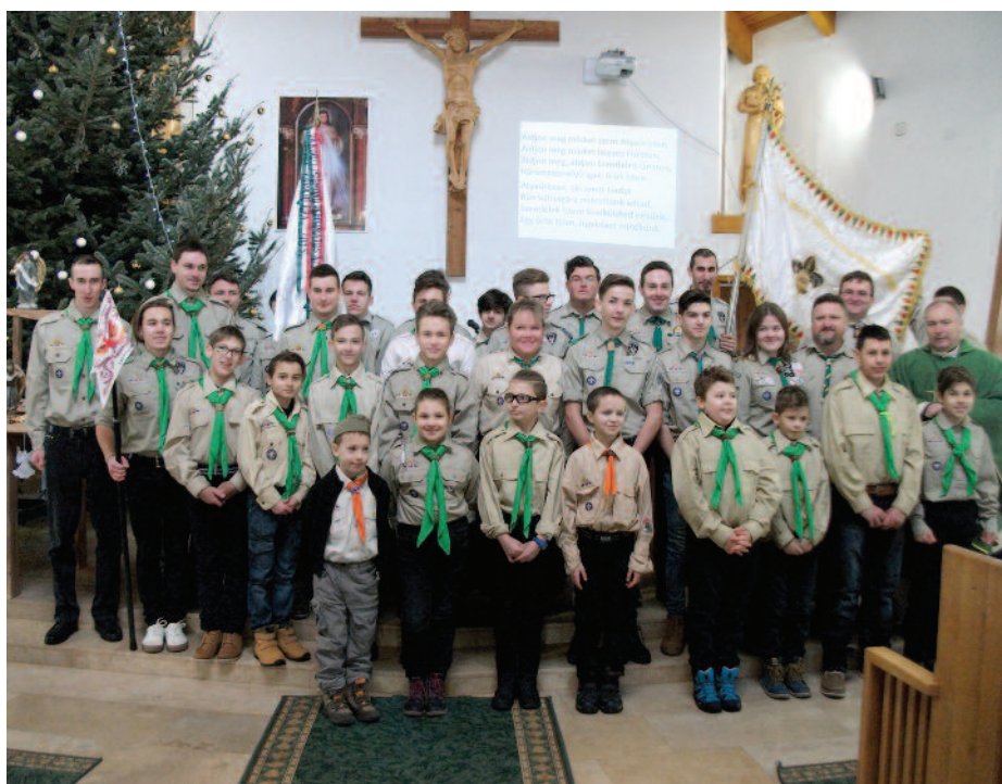
Cserkész fogadalomtétel Szerencsen