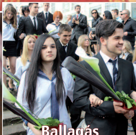
Ballagás a középiskolákban (cikkünk a 10-11. oldalon)