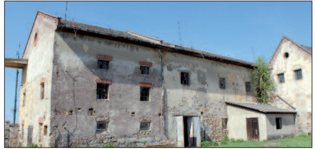
A rekonstrukció várhatóan 2015 őszére fejeződik be.

Korábban beszámoltunk arról, hogy a Tokaj-Hegyalja Nemzeti Programban elkülönített kétmilliárd forintos keretből a borvidék 27 települése közül Szerencs Város Önkormányzata a legnagyobb összegre, 200 millió forintba pályázott a volt cukorgyári raktárépület felújítására. A most induló beruházás keretében megvalósulhat az építészeti értékes, de mára romos állapotban lévő, helyi védelem alatt álló épület rekonstrukciója, mely után itt helyezik el a település hírnevét adó szerencsi csokoládégyártás történetét bemutató kiállítást, továbbá családbarát szolgáltatásokat is nyújtó turisztikai centrumot hoznak létre.