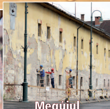
Megújul a cukorraktár épülete (cikkünk a 3. oldalon)