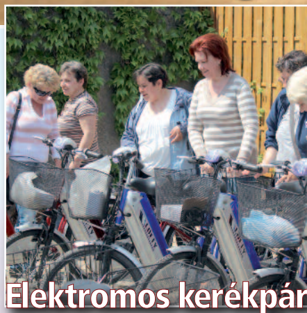
Elektromos kerékpár a gondozóknak (cikkünk a 7. oldalon)