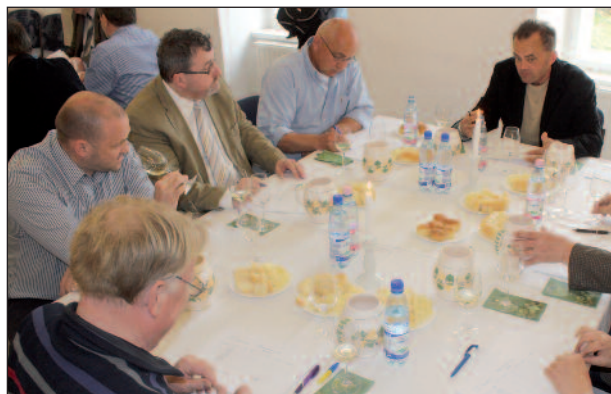
Szakavatott zsűri értékelt a nevezett italokat.