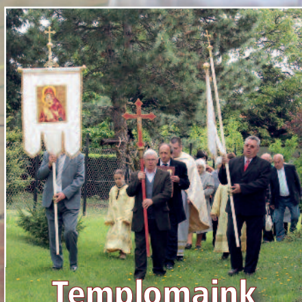
Templomaink húsvéti programja (a 3. oldalon)