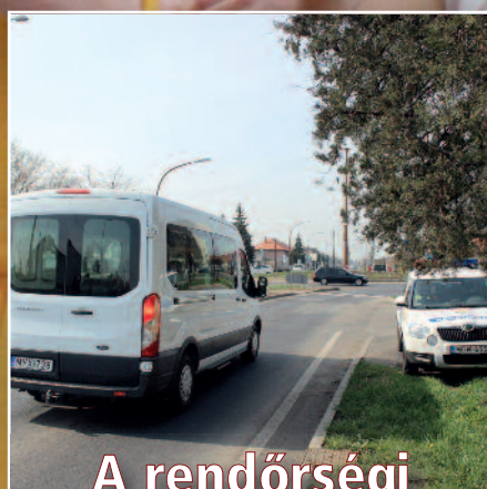
A rendőrségi szuperkamera (cikkünk a 4. oldalon)