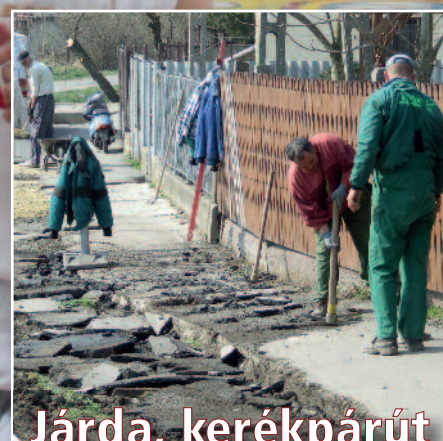
Járda, kerékpárút és parkosítás (cikkünk az 5. oldalon)