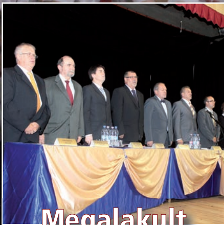
Megalakult az új önkormányzat