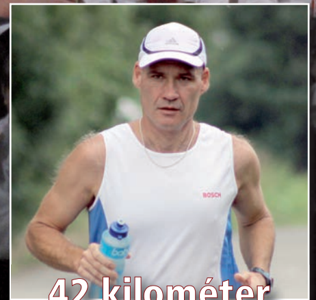
42 kilométer Berlin utcáin