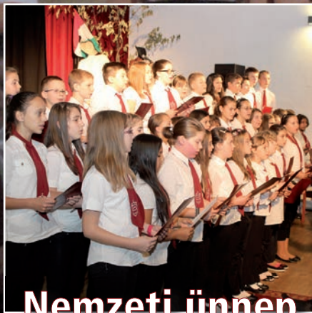
Nemzeti ünnep Szerencsen