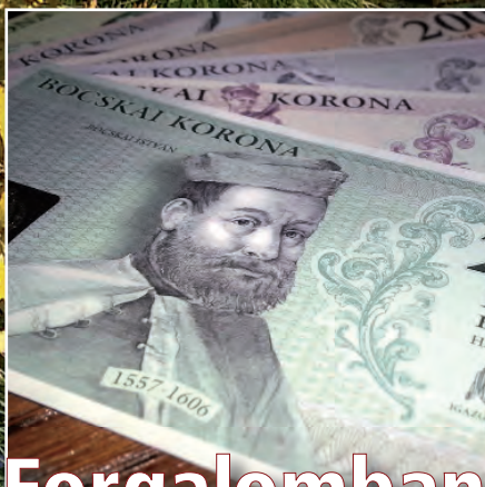
Forgalomban a helyi pénz?