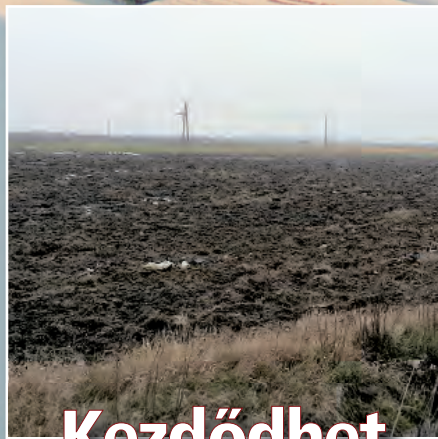
Kezdődhet a beruházás