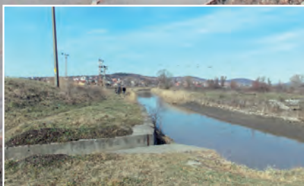
Árvízvédelmi beruházás Szerencsen