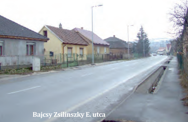
Bajcsy Zsilinszky E. utca