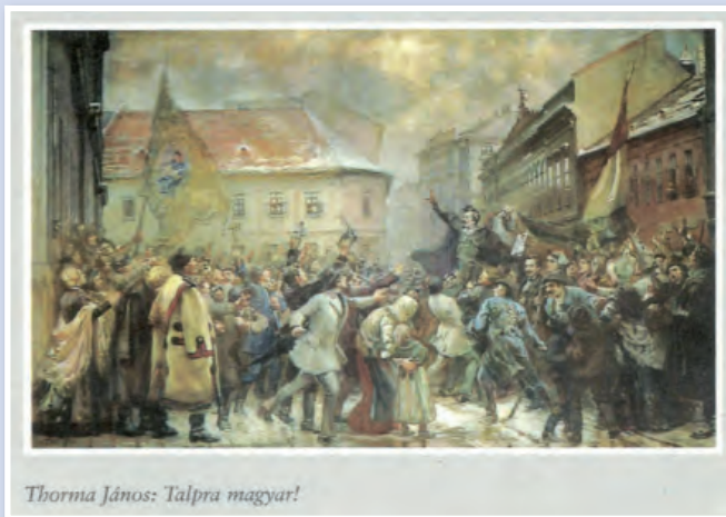
Thorma János: Talpra magyar!