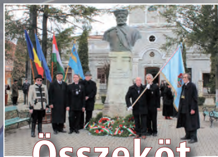
Összeköt a közös múlt