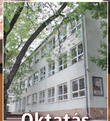
Oktatás erkölcsi alapokon