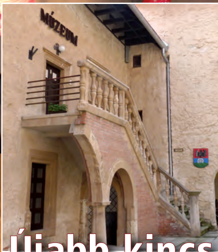
Újabb kincs a város tulajdonában