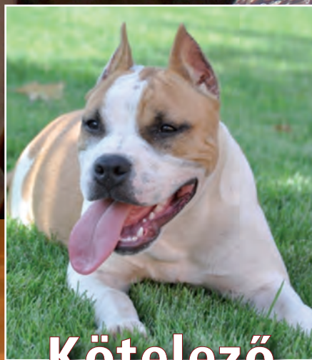
Kötelező a kutyachip