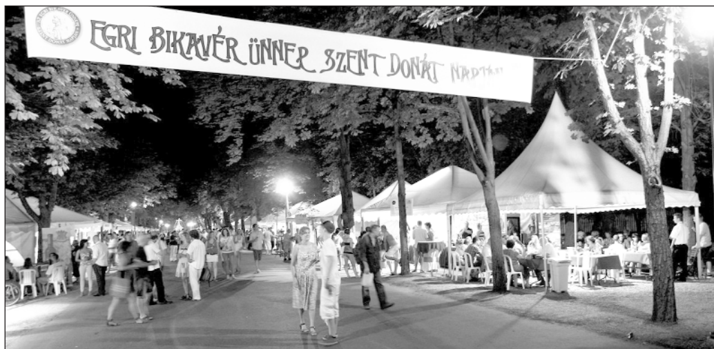
A hőség ellenére tízezrek látogattak Egerbe.

Két ismertebb legendája is van az Egri Bikavérnek. Az egyik szerint Arezzo püspökére, Donára mise közben rátörtek a pogányok, és a borral teli kelyhet kiverték a kezéből. A darabokra tört edény azonban Donát imájának hatására újra használhatóvá vált. A mártírhaltalt püspök ereklyéit kísérő papot később villámcsapás érte, de nem történt baja. A csodát a hívek Szent Donát közbenjárásának tulajdonították. Azóta hozzá fohászkodnak azok, akik védelmet remélnek az elemek ellen.