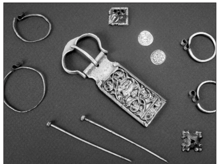
Restaurált tárgyak a református templom kertjéből: 11-12. századi ezüst és bronz „S”-végű hajkarikák, Könyves Kálmán és I. Ferdinánd ezüstdenárjai, 13. századi szarvasos kun csat és 15. századi bronz hajtűk a sírokból.