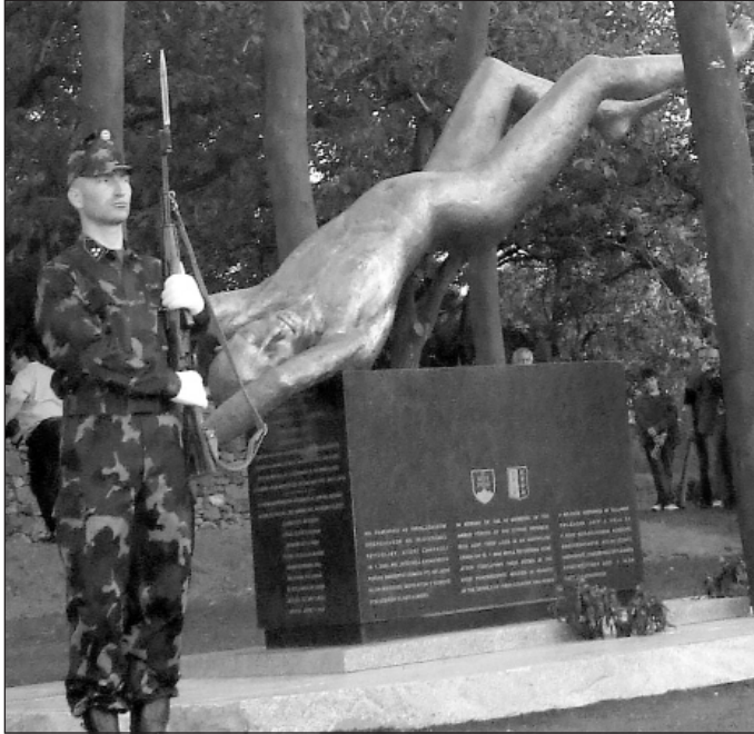
A 2006-ban elhunyt katonák tiszteletére emlékművet avattak Hejce főterén a következő év májusának közepén

Néhány száz métert sem teszünk meg, amikor látom, vagy látni vélem, hogy Hejce irányából felvillan egy jármű megkülönböztető fénye. – Te! – fordulok balra, a volán irányába – menjünk Hejcére, ott villog valami – mutatom az irányt, hátha