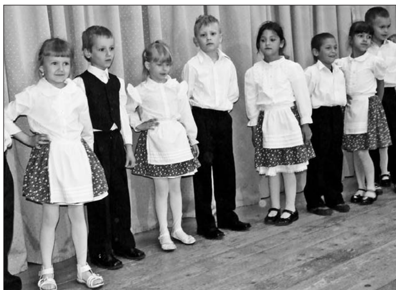
Népi viseletben táncoltak az ovisok.