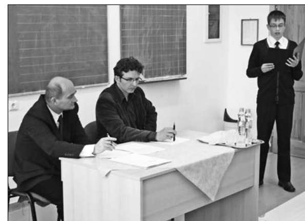
A verseny célja az anyanyelv ápolása.

A Szerencsi Többcélú Kistérségi Társulás és az oktatási intézmény szervezésében nyolc településről idén 35 versenyző érkezett az anyanyelvi megmérettetésre. A verseny célja az volt, hogy a diákok megmutassák: a nyelvapolás mindannyiunk kötelessége. A résztvevők főként XX–XXI. századi, prózai stílusban megírt irodalmi vagy igényes köznyelvi szöveget adtak elő. A zsűri munkája nem volt könnyű, mivel a tanulók jól felkészültek, így csak kis különbségek döntöttek a helyezettek sorrendjében. Reméljük, hogy a népszerű verseny tovább mélyítette a tanulókban anyanyelvünk szeretetét, és körükben egyre több hívet szerez a szép magyar beszéd ügyének.