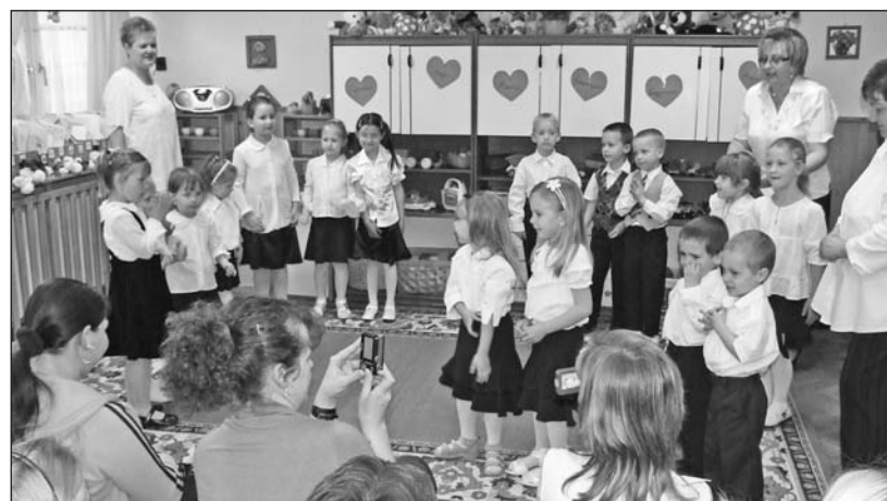
A gyerekek ünnepi műsorral kedveskedtek az édesanyáknak.

anyáknak nyílik az ébredő természet minden virága. Amerre a szem ellát, fiatal hajtások köszöntik a napsugarat, amely életre kelti az alvó rügyeket, táplálja a zsenge leveleket. Ezen a napon csillogó szemmel, elszoruló torokkal nyújtottuk át az ovisokkal a szeretetet, a hála és köszönet virágait. A költők felejthetetlen szépségű szavakkal, színekkel, érzéssel fejezték ki az anyai iránti szeretetet, melyet egy csokorba öszszekötve nyújtottak át anyák napján az ovisok a meghívott édesanyáknak és nagymamáknak, s abban a virágban, az ölelésben, és dalban benne volt minden hálás szeretet. Mindennek a jelentőségét a következő gondolat fejezi ki talán a legjobban mindannyiunk számára: „Hogyha virág lennék, ölelnék jó illattal, / hogyha madár lennék, dicsérnélek zengő dallal. / Hogyha menybolt lennék, aranyappal, ezüstholddal, / beragyognám életedet csillagokkal.”