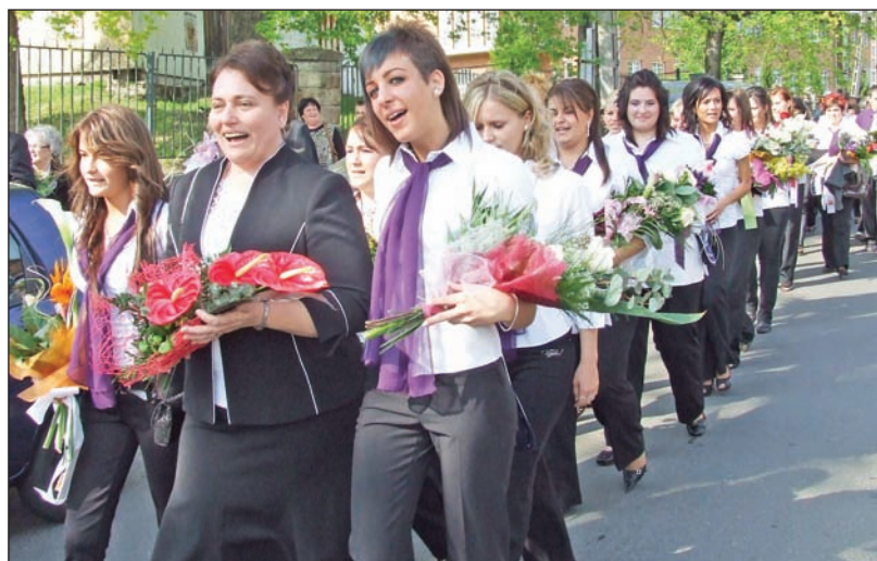
A ballagók egy utolsó közös sétára indultak.

Öröm és egyfajta szomorúság tükröződött mind a búcsút intó diákok, mind a pedagógusok arcán, hiszen a tanulók az évek alatt kialakult, családi környezetet hagyták maguk mögött, míg a tanárok a „beért gyümölcsöktől” váltak meg. Ünnepi beszédében Kovács Julianna, a tanintézmény igazgatója arra hívta fel a figyelmet, hogy az élet egy tűnő minutumáról van szó ugyan, ám olyan pillanatról, amely mellett érdemes megállni. Bár az iskolai időszakot lezárja az utolsó csengőszó, a diákevek történéseit nem törli ki az emlékekből. – Ha az iskolára gondoltok, talán halljátok a nagyszünet zaját, érzitek a kréport a levegőben, látjátok barátaitok arcát. Bízom abban, hogy emlékeitek évek múlva is összekötnek majd titeket egymással és az iskolával. Soha az életben nem lesztek többé olyan okosak, olyan szépek és olyan fiatalok így egyszerre, mint ahogyan most. Őrizzétek meg ezt a pillanatot, raktározzátok el azon emlékek