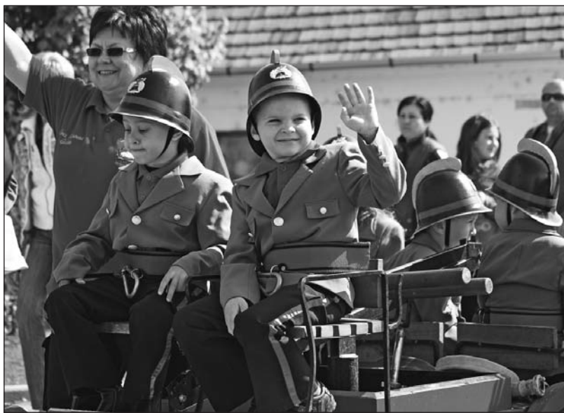
A látványos felvonulásból a kicsik is kivették a részüket.