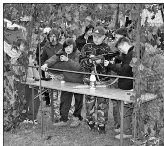
A lövészet egy formáját is kipróbálhatták az érdeklődők.