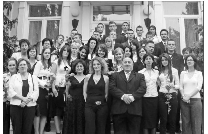
Harmincegyen intettek búcsút a diákszállónak.