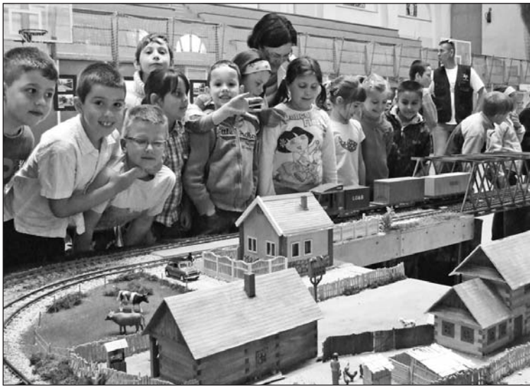
A kiállításon számos terepasztal volt látható.