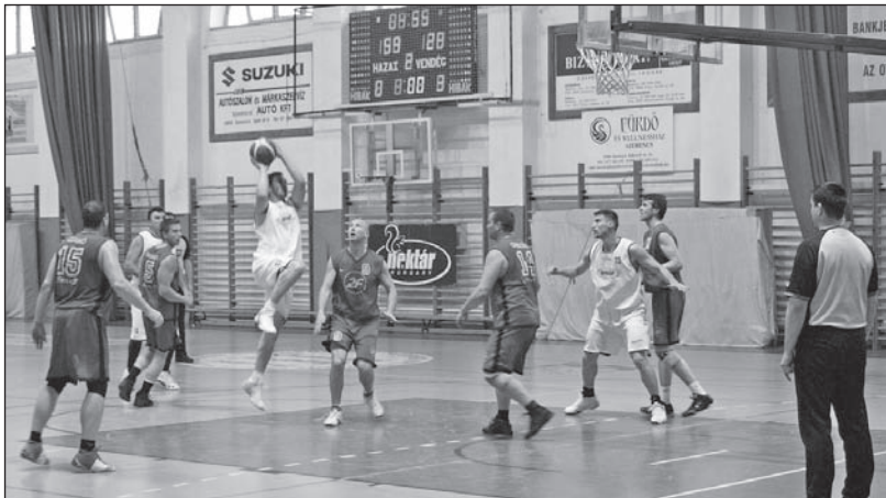
Szerencs csapata ismét diadalmaskodott.