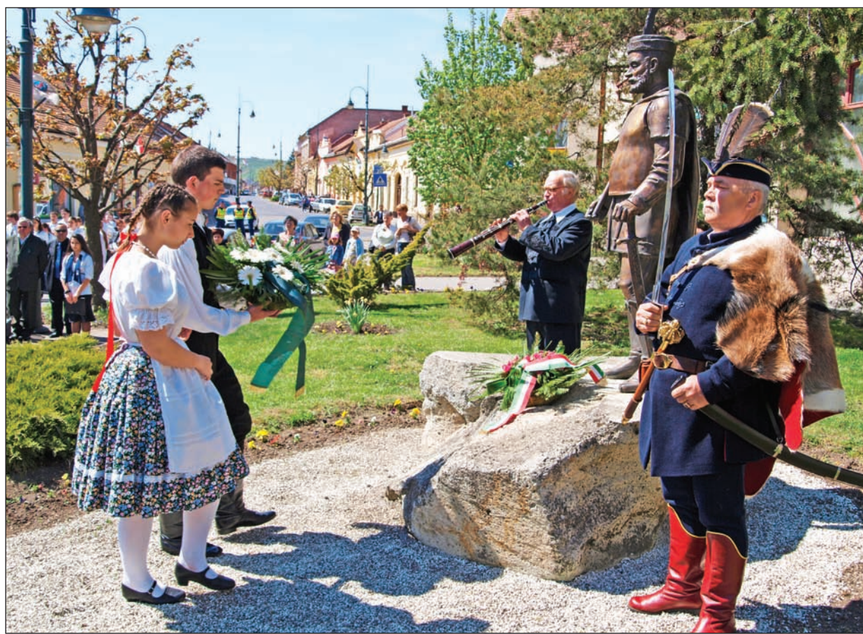
Elhelyezték az emlékezés koszorúit.

1605. április 17–20. között Szerencsen ülésezett a magyar országgyűlés. A rendek – a szabadságharc sikerein felbuzdulva – Bocskai Istvánt választották Magyarország fejedelmévé. Erre az eseményre az idén eddigigél szerényebb keretek között, de kellő méltósággal, színvonalas rendezvénysorozattal emlékeztek a városban.