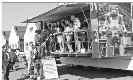
A különleges jármű az erőmű munkájába engedett bepillantást.

A Paksi Atomerőmű Zrt. a Magyar Villamos Művek vállalatcsoport tagjaként a hazai villamosenergia-termelés meghatározó résztvevője. Termelő tevékenysége során elsődleges célja, hogy – a magyar árampiac kiemelkedő szereplőjeként – a hazai fogyasztók megbízható és olcsó villamosenergia-ellátását biztosítsa, mindezt a környezet és a Föld légkörének megóvásával, a fenntartható fejlődést segítve. Ebbe a munkába engedett bepillantást május 6-án az a városban parkoló kamion, amelynek belső tere az erőmű megismertetésével kap-