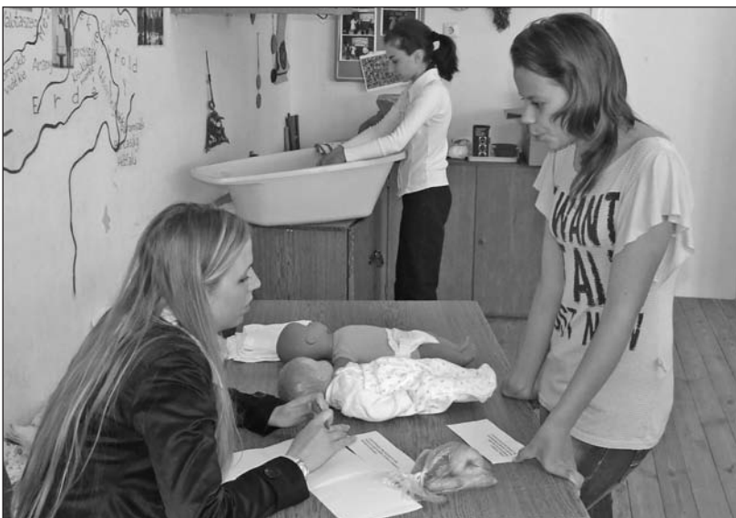
A versenyzők a csecsemőgondozás fogásait is megmutatták.