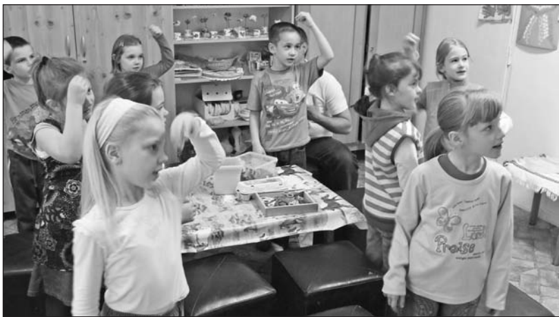
A záró foglalkozás közös játékkal kezdődött.