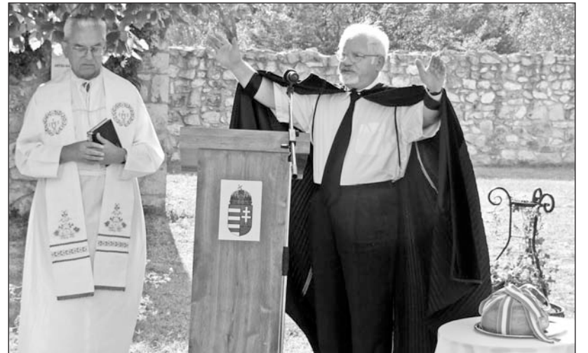
Mindennapi kenyérünk áldása.

Másnap este a Jézus Krisztus Szüpersztár című produkciót mutatta be a tiszalúci Tűzvirág Művészeti Egyesület a népes közönségnek.