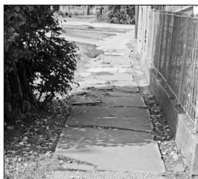
Hat kilométer járda újul meg Szerencsen.

hatmilliárd forint értékű beruházás valósulhat meg Borsod-Abaúj-Zemplén, Heves és Nógrád megyékben. Az egyenként legfeljebb 20 és 50 millió forint összegű fejlesztések között jellemzően óvodák, iskolák és rendelők rekonstrukciója, útfelújítások, közbiztonsági beruházások szerepelnek. A kiírásokra mintegy 100 pályázat érkezett, amelyeknek a felét kedvezően bírálta el a tanács, az odaítélt összeg megközelíti a 4,3 milliárd forint. Ebből a pénzből közel száz kilométer út és járda épül és húsznál is több oktatási, nevelési és egészségügyi létesítmény újul meg. A pályázati kiírásban új elemként jelent meg és komoly érdeklődést váltott ki a közcélú foglalkoztatáshoz szükséges gépek és eszközök beszerzéséhez igényelhető támogatás. Ilyen módon közel ötezer ember kereső tevékenységét támogatják. Harminc körüli azoknak a településeknek a száma, ahol új, a legkorszerűbb biztonsági szabványnak megfelelő játszótér építenek. Emellett a közbiztonság javítása is egyre inkább a figyelem középpontjába kerül a településeken térfigyelő rendszerek kiépíté-