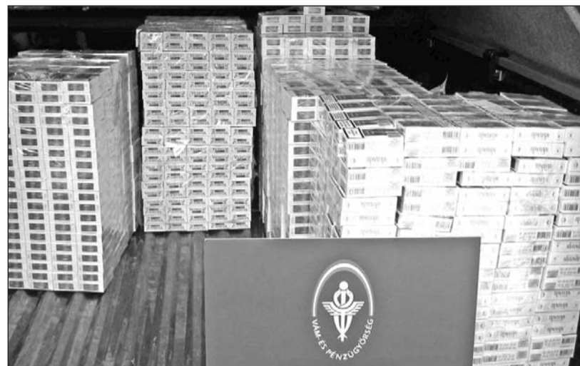
Miskolcon több mint ötmillió forint értékű csempészcigarettát foglaltak le a vámosok.

A vámosok a régióban csaknem négyezer ellenőrzést hajtottak végre az idei esztendőben. A testület új mobil ellenőrző szolgálatot hozott létre, amely eredményes munkát végez, elsősorban illegális jövedéki termékek felderítésében. Szabó Zsolt regionális parancsnok ismertette, hogy az idei év változásai között szerepel a teljes körű elektronikus vám európai uniós bevezetése. A regionális parancsnokság a tervezett első féléves bevételeit 500 millió forint-