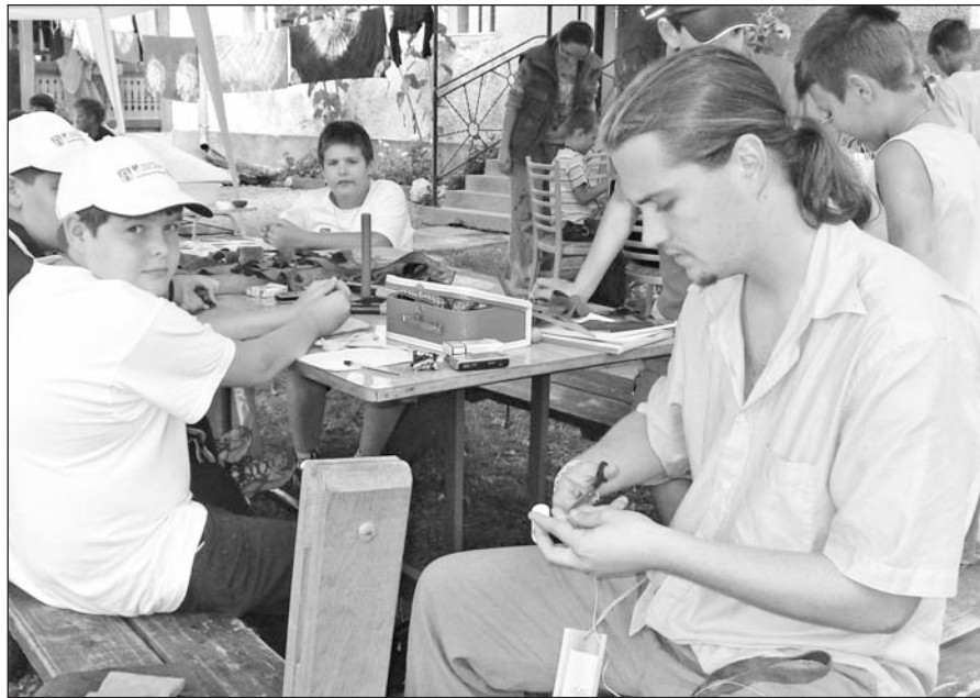
A szerencsi diákok örömmel vettek részt a bőrműves-foglalkozáson.

A jövő európai nemzedékét képviselő szlovákiai és magyarországi fiatalok közötti kapcsolatépítés a célja annak az Európai Unió által támogatott projektnek, ami Szerencs testvárosával, Rozsnyóval közösen valósul meg az elkövetkezendő egy esztendőben. A program keretében augusztus 10-én szerencsi gyerekek utaztak a szlovákiai várhosszúréti kézműves táborba.