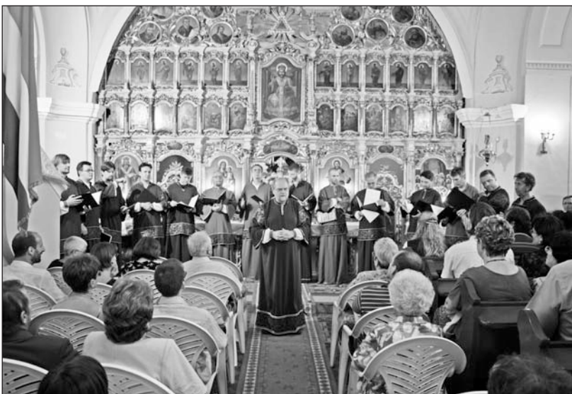
A Szent Efrém férfikar visszatérő vendég Szerencsen.

A zsúfolásig megtelt templomban Magyarország egyetlen professzionális bizánci zenei együttese repertoárjában a liturgikus zenét helyezi előtérbe. Fő céljuk, hogy a magyarországi és a kelet-európai bizánci rítusú egyházak zenei kincsait autentikus módon szólaltassák meg. Mindezek mellett azonban időnként műsorukra tűzik a magyar és nemzetközi férfikari repertoár egyes darabjait is.