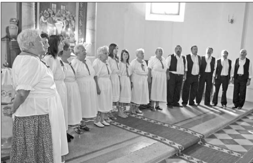
A tályai Kővirág Népdalkör elsőként lépett fel a közönség előtt.