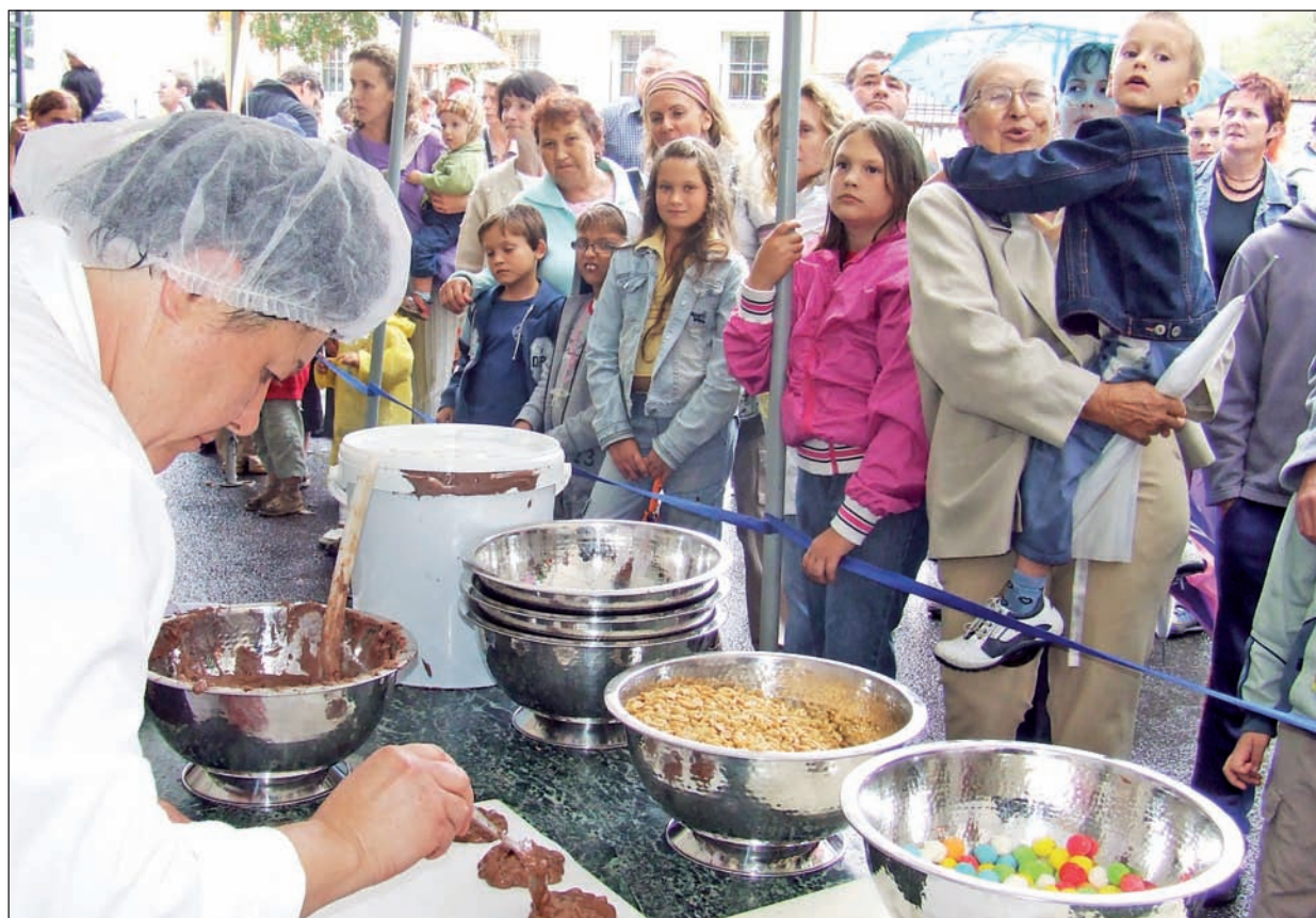
Sokan voltak kíváncsiak a kézi csokoládékészítésre.

Második alkalommal rendeztek csokoládéfesztivált augusztus 23-án Szerencsen. A esős időjárás ellenére sok vendég fordult meg vásárnap az „édes városban”, válogatva a finomságokból és a kulturális programokból.