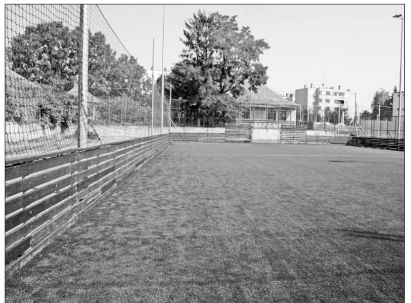
Felújított szabadtéri műfüves sportpálya várja a vakációról visszatérő diákokat a Bocskai gimnáziumban.

A vakáció idején is nagyüzem volt a szerencsi Bocskai gimnáziumban. Miközben egymást váltották az intézményben a különböző nyári táborok, az iskola karbantartói is szorgalmasan dolgoztak. Hozzáálltak többek között a kondicionáló terem, öltözők és több osztályterem festéséhez, felújításához. A műfüves pálya burkolatán, hálóján és palánkján is elvégezték a szükséges javításokat. Az idén végzett osztályok termeiben a parketta lakkozása is megtörtént. Megújultak az intézményben az öltözők és a mosdók, elvégezték a tenispálya öntözőrendszerének a rekonstrukcióját. A tanári szobába három új számítógép került. A középiskolai kollégiumban a közmunka-program keretében festették le az egykori szolgabírói hivatal épületeinek külső homlokzatát. A falak festése mellett beépítették az új kapunyitó és -zároszerkezetet is. Megtörtént az ebédlői mosdók felújítása. A kollégium vezetése továbbra is nagy gondot fordít az udvar parkosítására, annak karbantartására. A nyári szünidő