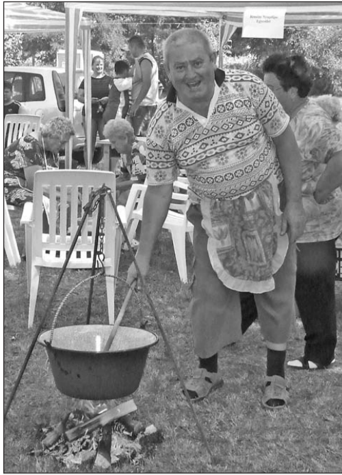
Jó hangulatú főzőversennyel kezdődött az ideji ünnep.

Tizenegyedik alkalommal rendeztek falunapot a szerencsi kistérséghez tartozó Taktaszadán. Az augusztus 15-ei esemény kora délelőtt, a hagyományos főzőversennyel kezdődött. A finom ízek és illatok próbáján nem csak a helybéliek, hanem a környező településekről érkezett „bográcsbajnokok” is kitétek magukért.