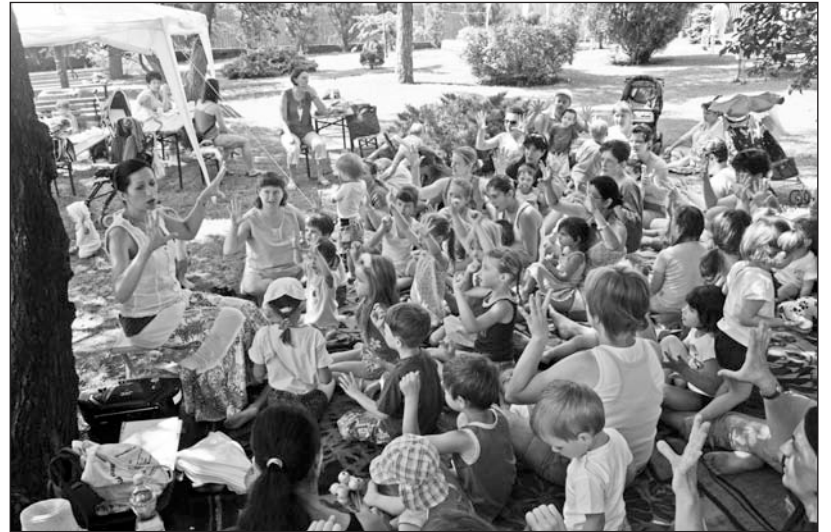
A Kolompos tábor évek óta teltházzal működik.

A nyári szünetben nagyüzem volt a szerencsi középiskolai kollégiumban. Ebben az időszakban táborlók, a térségbe érkezett turisták, közösségek érkeznek a szobákba, akik augusztus elejéig összesen közel ötezer vendégéjszakát tölthetnek az intézményben.