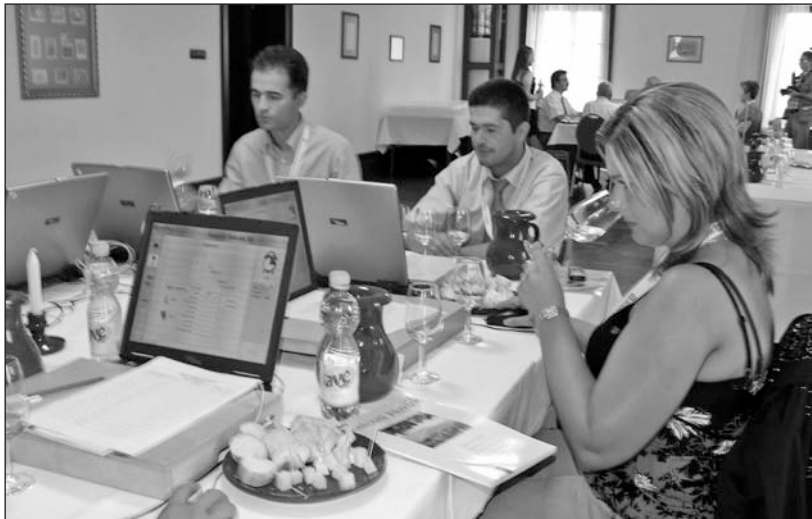
Kiváló nedűket kóstoltak a bírók.

Tarcalon rendezte augusztus 11-én és 12-én a XXXI. Országos Borversenyt a Hegyközségek Nemzeti Tanácsa. A legrangosabb hazai szakmai megmérettetésre 112 termelő összesen 334 mintával nevezett.