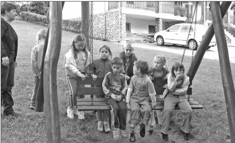
Kirándulás közben jól esett a pihenő.