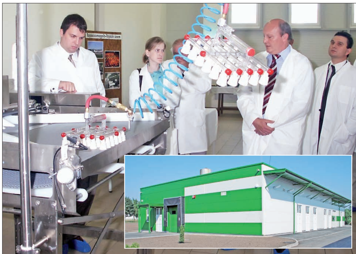
A világszínvonalú tojásléüzemet Ficsor Ádám, tárca nélküli miniszter (a fotón balra) adta át.

Az elmúlt évtized egyik legjelentősebb fejlesztését valósította meg a Szerencsi Mezőgazdasági Zrt. A cég Siska tanyáján felépült korszerű tojásléüzem ünnepélyes átadását július 18-án tartották.