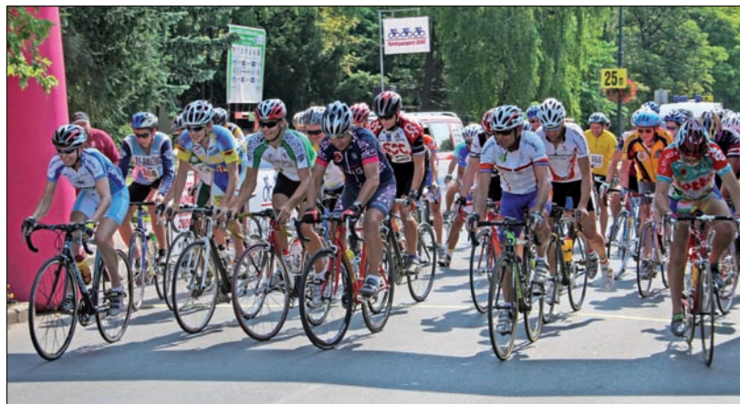
Közel száz biciklista vágott neki a Szerencs Nagydíjnak.