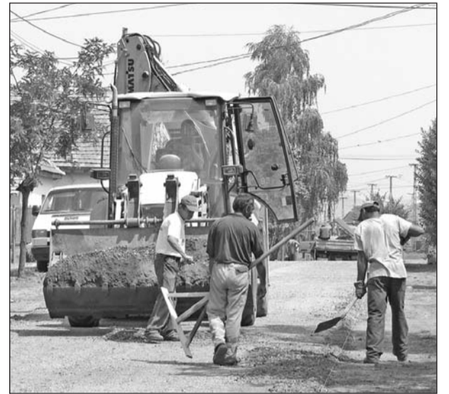
A Kultúrház utca burkolata megérett a felújításra.

lethez fordultak szilárd burkolatú utat kiépítése érdekében. Nem volt megoldott a csapadékvíz elvezetése, esős időben alig lehetett autóval ide behajtani. Ez komoly gondot jelentett nem csak a lakóknak, hanem