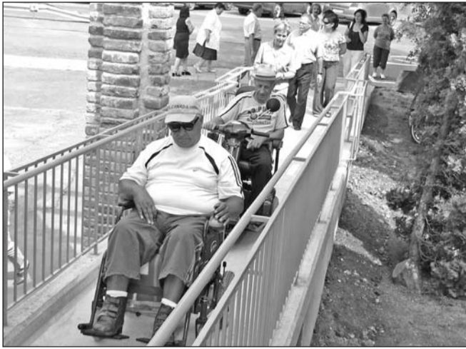
Kerekessel is megközelíthető lett a polgármesteri hivatal.