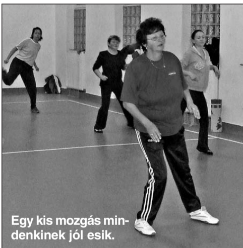
Egy kis mozgás mindenkinek jól esik.