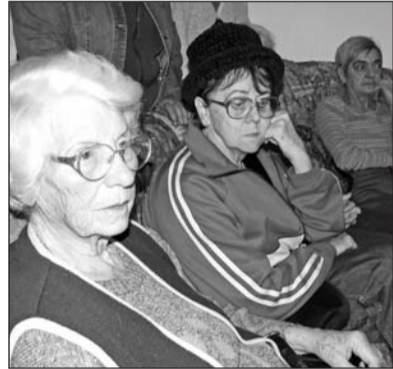
A karácsony mindenkié...