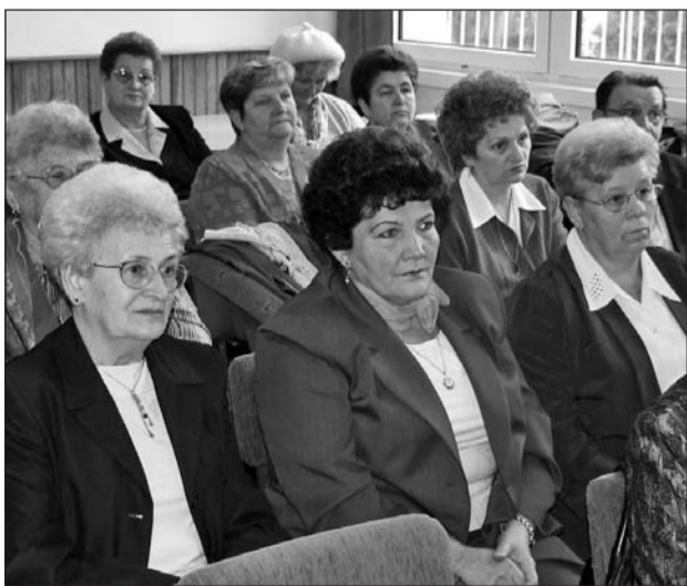
Nyugdíjasok találkoztak a gimnáziumban.

Nyugdíjas pedagógusok, az egykori konyha dolgozói, régi ismerősök, kollégák, barátok érkeztek december 18-án a szerencsi Bocskai gimnáziumba.