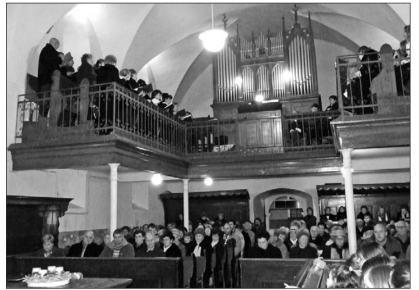
Csodálatos dallamok csendültek fel a templom falai között.

Zsúfolásig megtelt az ondi Idősek Klubjának nagyterme, amikor a nyugdíjasok köszöntésére érkeztek a helyi óvodás és általános iskolás gyermekek. Az asztalon már világított a