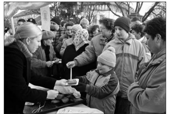
Jól estek a finom falatok az ünnepi forgatagban.

További fotók: www.szerencsihirek.hu/galeria/galeria/