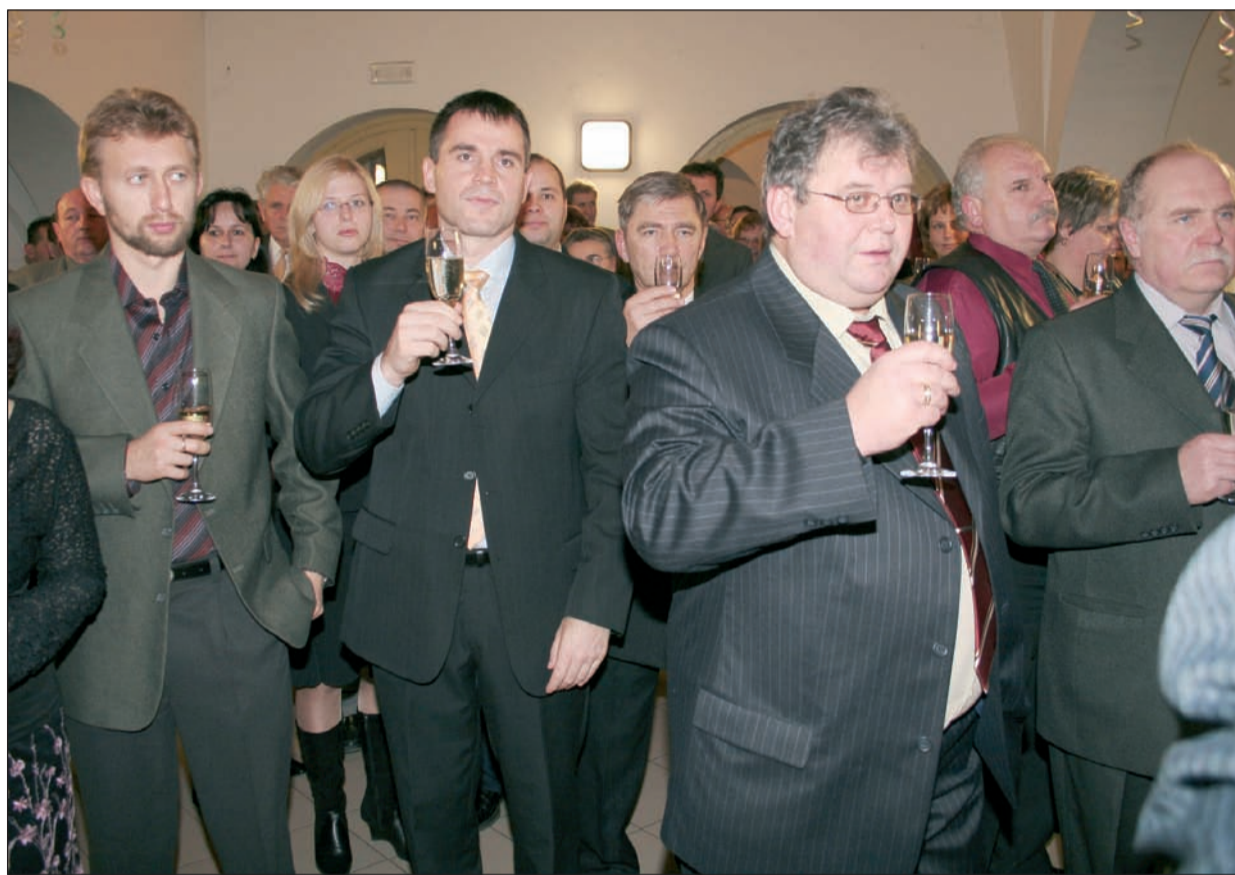
A feladatok teljesítését az állam által biztosított támogatások mellett a helyi gazdálkodók által befizetett adóforintok is segítették.