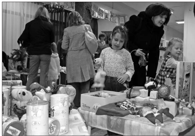
Nagy a nyüzsgés az asztalok körül.

Szerencs két nevelési intézményében rendeztek december 13-án Luca-napi vásárt. A Napsugár Óvodában már kora reggel gazdagon megpakolt asztalok várták a szülőket és gyermekeiket, hogy kedvükre válogathassanak a vásárfiák között. A karácsonyi díszek és ajándéktárgyaktól kezdve a finom édességekig szinte minden megtalálható volt a kínálat-