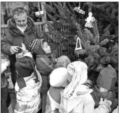
Elkezdődött a fenyő díszítése.

A Napsugár Óvoda apróságai közösen díszítették fel az intézmény udvarán felállított fenyőt. Később a foglalkoztató szobákban folytatódott az ünnep, ahová már itt is meghívást kaptak a gyermekek szülei, hozzátartozói. Felcsendültek az ismerős dallamok, meggyúltak a csillagszórók az óvoda falai között.