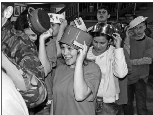
A pecúravató vidám pillanatai.