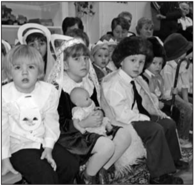
A Gyárkerti Óvoda gyermekei is nagyon várták már az ünnepet.