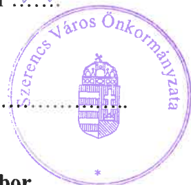
Nyiri Tibor polgármester Megrendelő