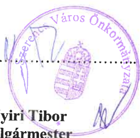
Nyiri Tibor polgármester Megrendelő