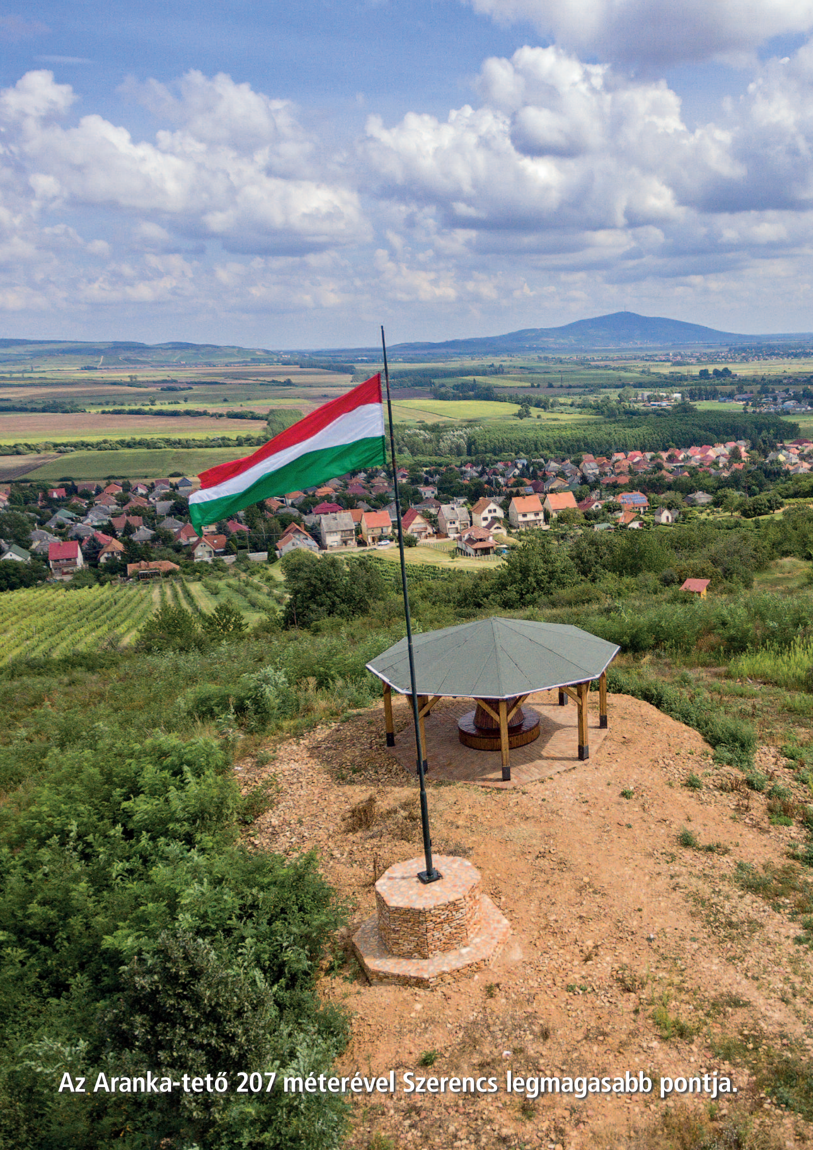
Az Aranka-tető 207 méterével Szerencs legmagasabb pontja.